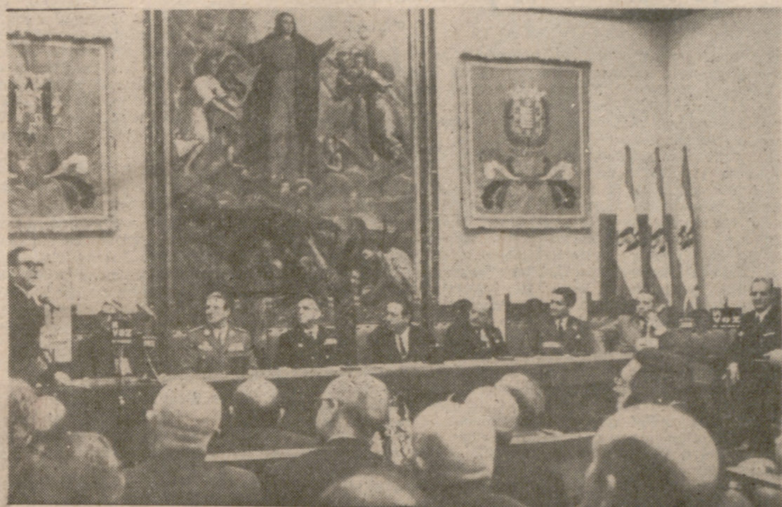
El almirante Núñez Iglesias, durante el discurso inaugural. (INFORMACION EN LA PAGINA SIGUIENTE)

Los ministros de Marina y Educación y Ciencia presidieron los actos «Te Deum» en la Catedral, apertura de la exposición lepentina y recepción en el Ayuntamiento