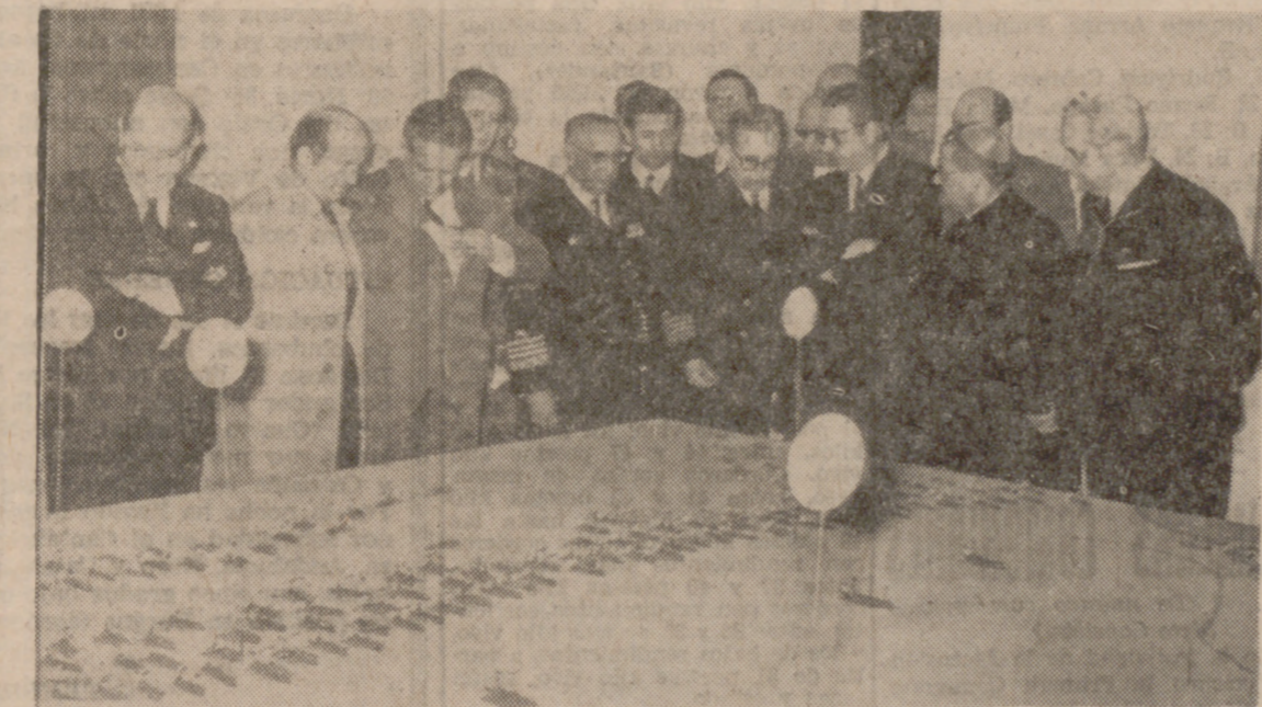
Visita a la Exposición en el Museo de Pintura de la Pasión. El almirante Núñez Iglesias explica a las ilustres personalidades algunos detalles de la maqueta que reproduce la Batalla de Lepanto.

Valladolid para la apertura de las conmemoraciones lepaninas, en el cuarto centenario de la Batalla, de una manera especial al almirante Núñez Iglesias, quien, como presidente de la Comisión Interminis-