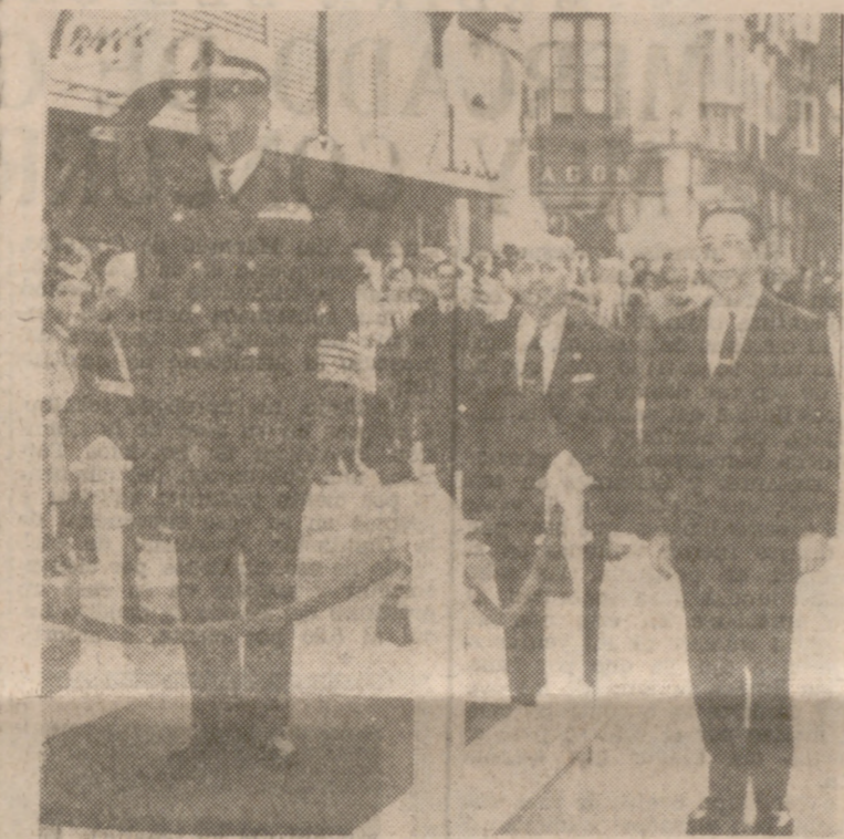
El Ministro de Marina presencia el desfile de la Compañía de Infantería, que rindió honores.

Terminado el «Te Deum», que se inició a las seis de la tarde, después de que en los alrededores de la Catedral los Ministros de Mari-