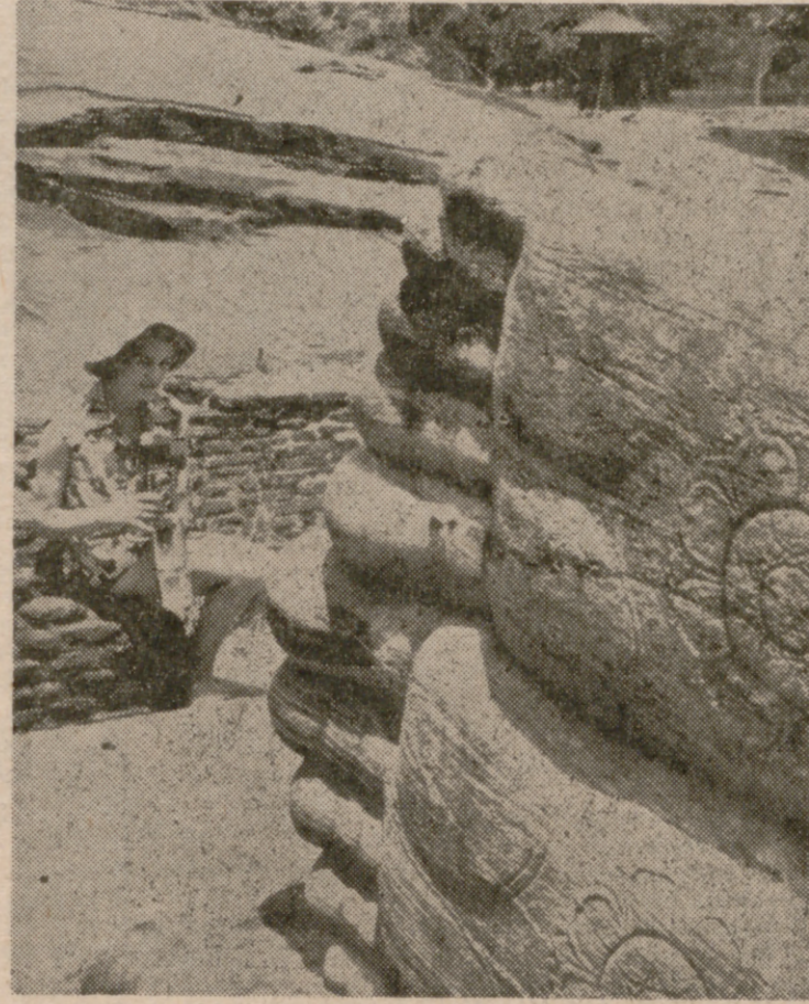
Junto a los monumentos autóctonos de miles de años de existencia, las iglesias cristianas se multiplican también por los caminos de Ceilán.

Por GUILLERMO DIAZ-PLAJA De la Real Academia Española