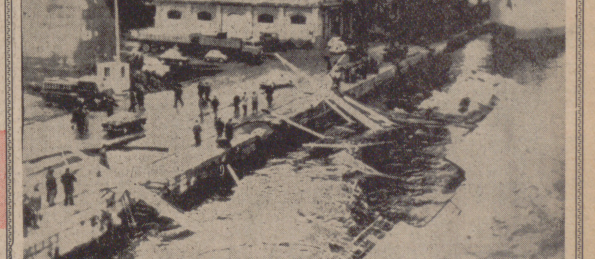
NAPLES (Italia).—El barco griego "Tropeóforos" aparece hundido en la bahía de Nápoles después de ser alcanzado por una tormenta. Los trece hombres de la tripulación resultaron ilesos.