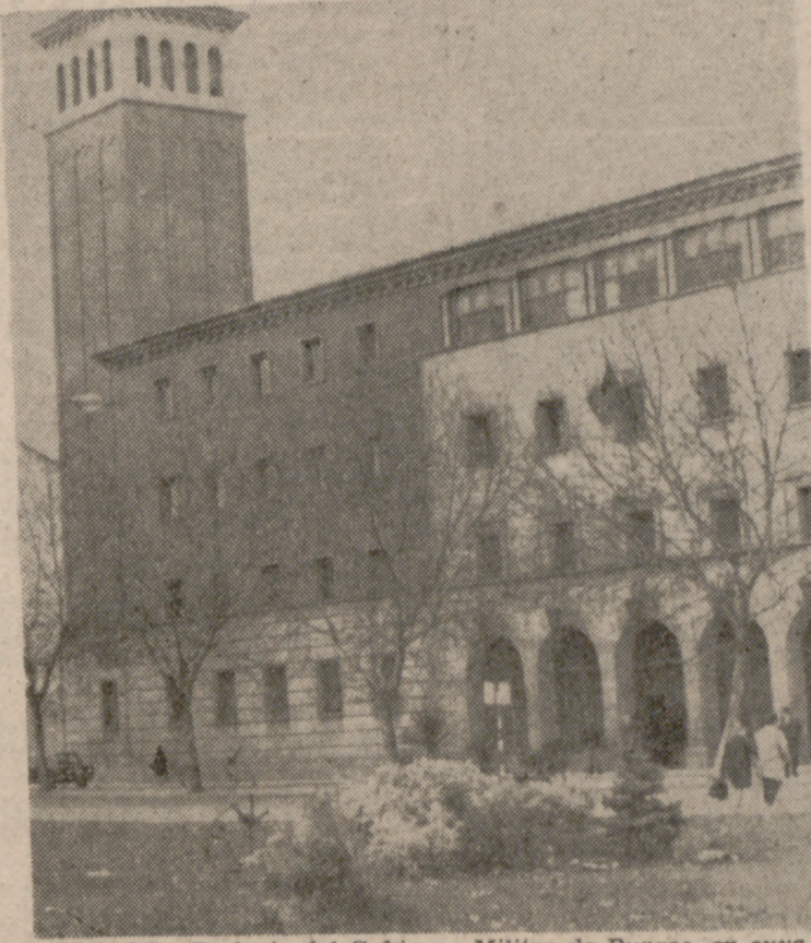
BURGOS.—Fachada del Gobierno Militar de Burgos, en cuya Sala de Justicia se ha celebrado el juicio contra dieciséis activistas de la ETA.

MADRID, 29. (PYRESA).—La Comisión Permanente del Consejo Nacional ha sido convocada para las cinco de la tarde de hoy, en el Palacio del Consejo.