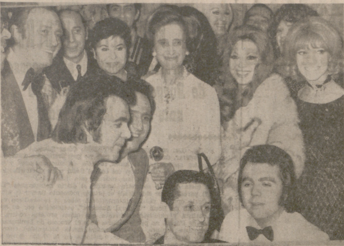
MADRID.—En el Teatro Calderón se celebró el tradicional festival de la Campaña de Navidad, presidido por la esposa del Jefe del Estado, doña Carmen Polo de Franco. En la fotografía, la ilustre dama posa, en el entreacto del festival, con algunos de los famosos artistas participantes.