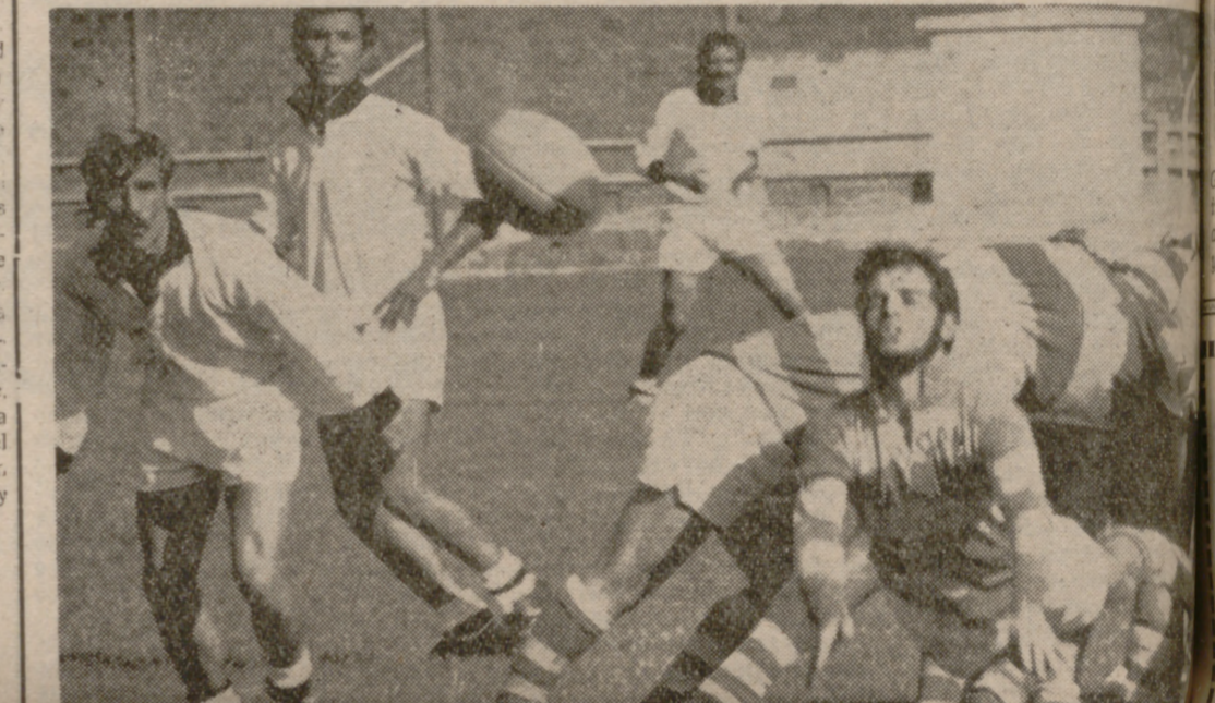
UNA JUGADA DEL INTERESANTE ENCUENTRO

En partido correspondiente a la segunda jornada de la Liga Nacional, jugado ayer en el campo del Frente de Juventudes, se enfrentaron los equipos del Salvador y el Canoe Natación Club. Una mañana espléndida y un terreno de juego en perfectas condiciones favorecieron la práctica del rugby.