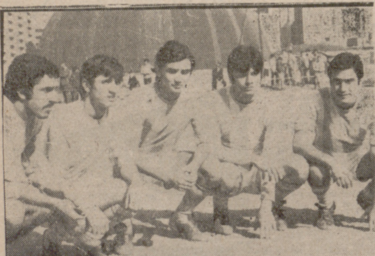
La delantera del Real Valladolid no pudo lucirse en esta ocasión. Un solo gol fue su renta ante el Arces.

El bloque compacto y veterano de la Ferrovial, que no se dejó intimidar por los ataques de los riosecanos.