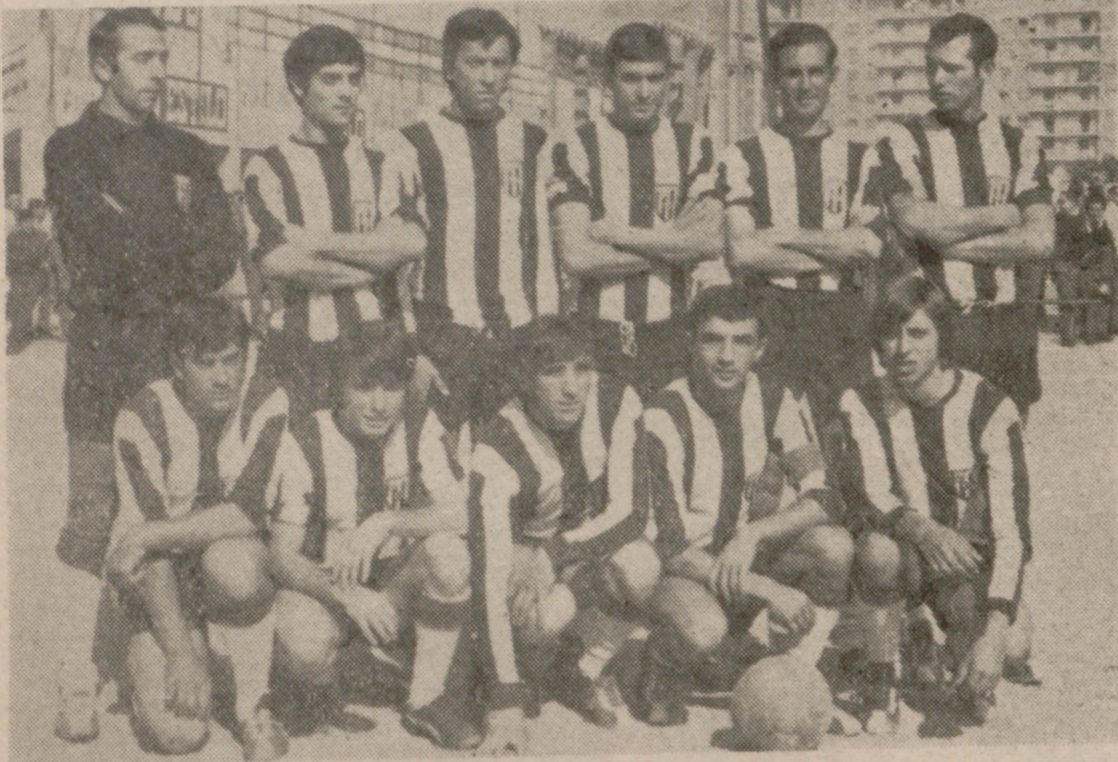
Formación del C. D. Rioseco, que pese a contar con el apoyo de su público, halló muchas dificultades para batir al Sava. De cualquier forma, los blanquinegros forman un equipo capaz de animar el torneo.

También resultaron triunfadores el Fasa, Arces y Laguna Pandoro