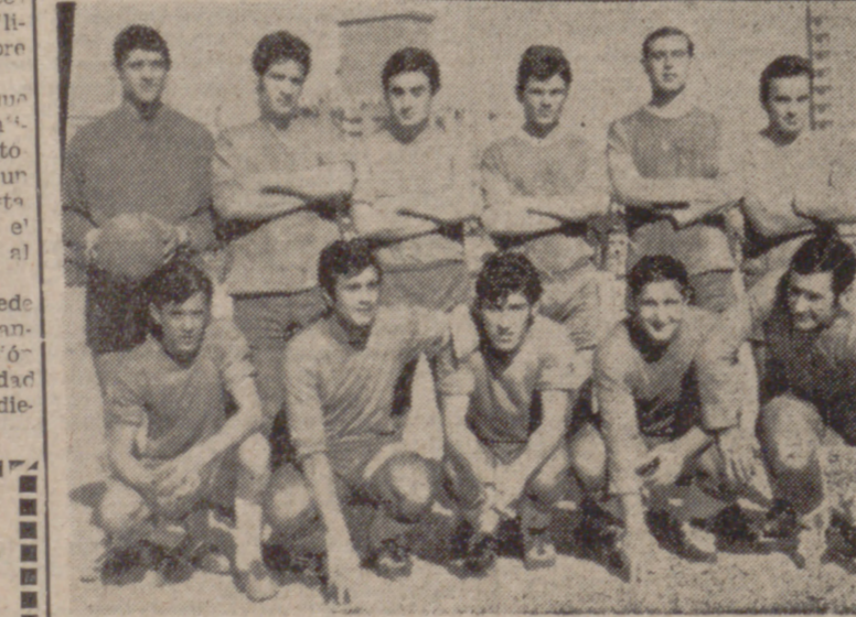
El Arces, que se impuso por la mínima diferencia al Valladolid, pero su triunfo fue justo.