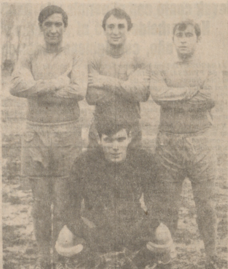
La retaguardia del Instituto Nacional de Colonización fue una de las líneas que con mayor acierto se batieron ante el Club Deportivo Benavente.

El C. D. Benavente, con una "hinchada" ruidosa y nutrida, venía dispuesto a ganar para seguir manteniendo sus esperanzas de ascenso. Sin embargo, y pese a haber dominado durante toda la segunda parte y al final del primer tiempo, sus artilleros han carecido de peligro y capacidad resolutiva en los últimos metros y de ahí que el Instituto de Colonización, aprovechando mejor las oportunidades, se haya hecho con la victoria, que frena a los zamoranos en su marcha hacia el liderato.