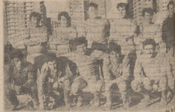
Formación del C. D. Arces, que marcha a la cabeza de la clasificación del "Trofeo Omnia".

que contrarrestada por el enorme poder combativo del Tordeillas. Ese afán de lucha del conjunto local impidió al Arces ejercer su prevista superioridad. El fútbol se desarrolló principalmente en el centro del terreno y superioridad de las respectivas defensas. Concluyó con empate a cero.