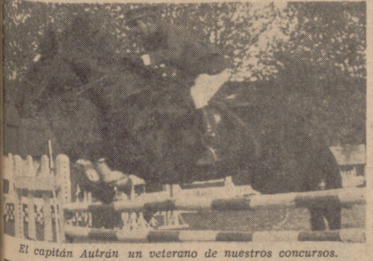
El capitán Aufrán un veterano de nuestros concursos.