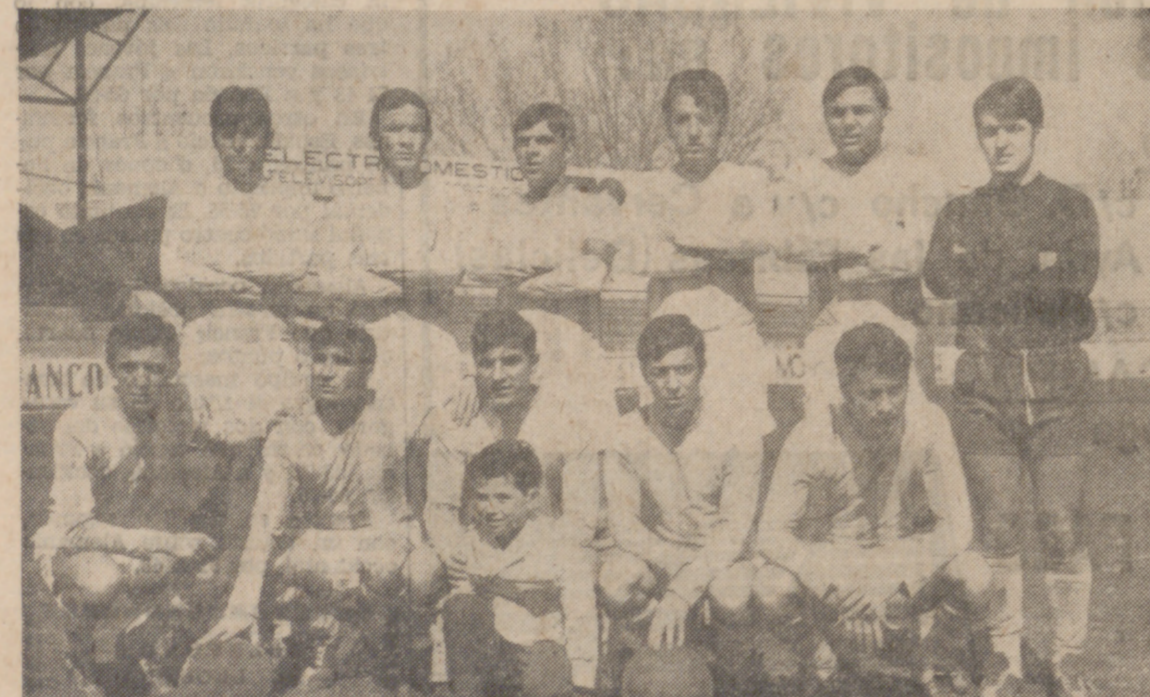
Otra fuerte derrota del Real Valladolid. En Béjar luchó sin suerte y sin acierto ante un enemigo claramente superior.

Mal le ruedan las cosas al Real Valladolid en esta fase de ascenso. Ha perdido su antigua fortaleza, su ritmo de juego y también su moral, y además está perseguido por el infortunio. Solo así puede entenderse su desalentante marcha en la liguilla, en la que ocupa el farolillo rojo, cosechando además fuertes derrotas, como la de ayer en Béjar.