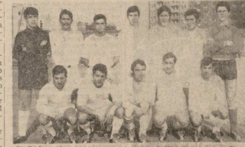
El Endasa alcanza el ascenso tras una brillantísima campaña.

El partido más importante de la jornada se disputó en el campo de la E. P. «Onésimo Redondo» y en él se decidió definitivamente el campeón del grupo segundo, aunque todavía falta una jornada para el final de la competición. Un empate le bastaba al Endasa para conseguir el ascenso a la Primera Categoría, mientras que el Redentoristas precisaba imperiosamente el triunfo para mantener, aunque remotos, las esperanzas de dar caza al líder.