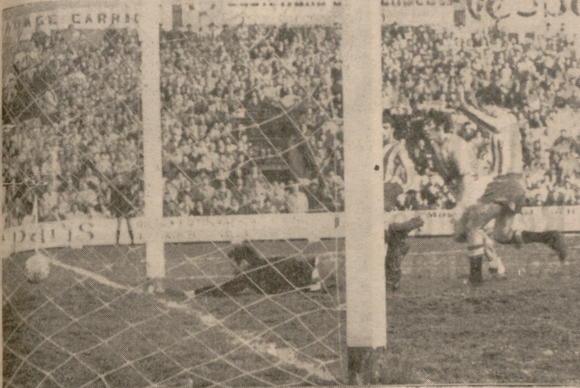
NO FUE GOL.—Aunque el efecto óptico parece indicar lo contrario, no hubo gol en esta ocasión. Castro, en el suelo, no alcanza la pelota, impulsada por Lasa, pero ésta saldría fuera. Otra ocasión fallada por los blanquívioletas.