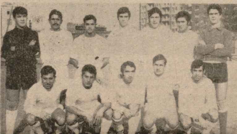
Formación del Endasa, un digno rival para los campeones. El llegar a la final ya fue un éxito para el líder de Segunda Categoría Regional.

La final de la Copa de Aficionados se disputó ante numerosísimo público y en medio de un clima de expectación, ya que aunque el Betis por su condición de "primera regional" y por su mayor experiencia en este tipo de finales, era favorito, los últimos éxitos del Endasa, al eliminar a equipos de superior categoría y, sobre todo, su excelente campaña en la Liga, hacían un adversario temible.