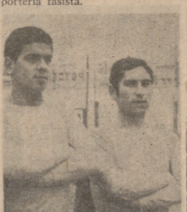
Línea media del Iscar C. F.

El equilibrio de fuerzas fue, en consecuencia, la tónica predominante del choque, que no perdió interés en ningún momento, no sólo por lo incierto del marcador, sino porque las oportunidades de gol fueron frecuentes en ambas porterías.