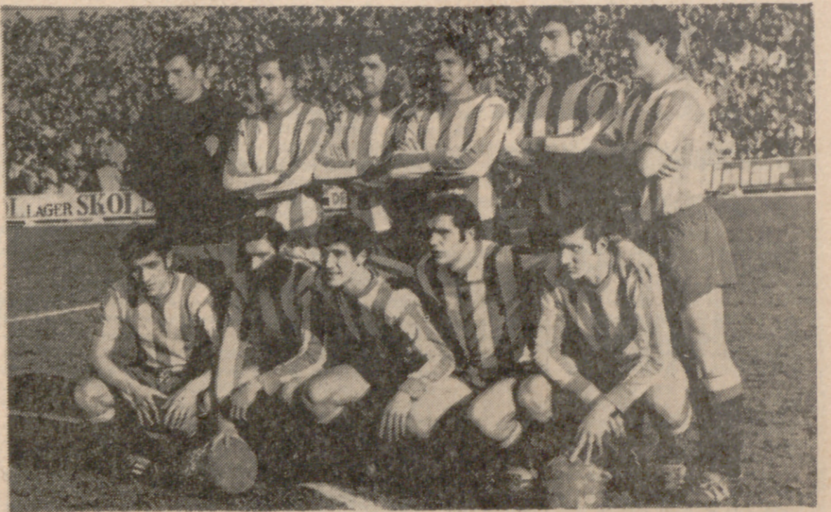
EL SPORTING, UN LIDER CON TODOS LOS HONORES.—No hay más remedio que descender ante el juego brillante y práctico del Gijón. Es un equipo joven, rápido, técnico y resuelto, al que actualmente es muy difícil frenar. En Zorrilla hizo buenos los pronósticos que le señalaban como el conjunto con más méritos y posibilidades para retornar a la división de los grandes, que desde hace varias temporadas persigue. Ahí tenemos a la formación que inició el partido de ayer.

Equilibrio e incluso dominio del Real Valladolid hasta el minuto treinta y siete; luego, el Gijón lo tuvo muy fácil Intento de reacción tras el descanso, que acabó con el tercer tanto astur, tras una nueva pifia de la zaga