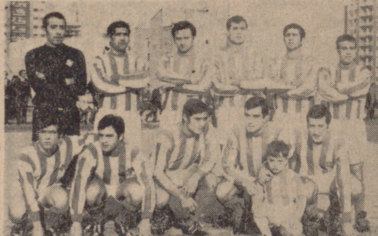
Una vez más, el Betis campeón de Aficionados. El conjunto verdiblanco, aunque con apuros, no defraudó el pronóstico, que le señalaba favorito.

En el bando contrario brillaron Calderón y Fortu. El Endasa ha sido un duro rival que estuvo a punto de dar muerte a la sorpresa. Luchó con tenacidad y mantuvo el equilibrio de fuerzas mientras pudo.