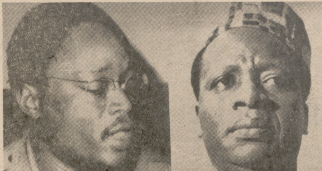
COTONN (Dahomey).—Fotografías del presidente de Dahomey, doctor Emile Derlin Zinsou (derecha), que ha sido depuesto por un golpe de Estado, cuyo líder, según se informa, es el jefe del Estado Mayor del Ejército, teniente coronel Maurice Kohandete (izquierda). Las últimas noticias indican que el presidente Zinsou resultó gravemente herido y fue llevado en un coche a un lugar no indicado.