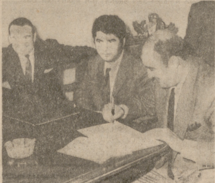
Sonrisas y buen humor a la hora de la firma. Esperamos que lo alegría dure.

“SI NECESITO JUGADORES DEL FILIAL, JUVENIL O AFICIONADOS, ECHARE MANO DE ELLOS. PORQUE SON RECURSOS NATURALES DEL PRIMER EQUIPO.”