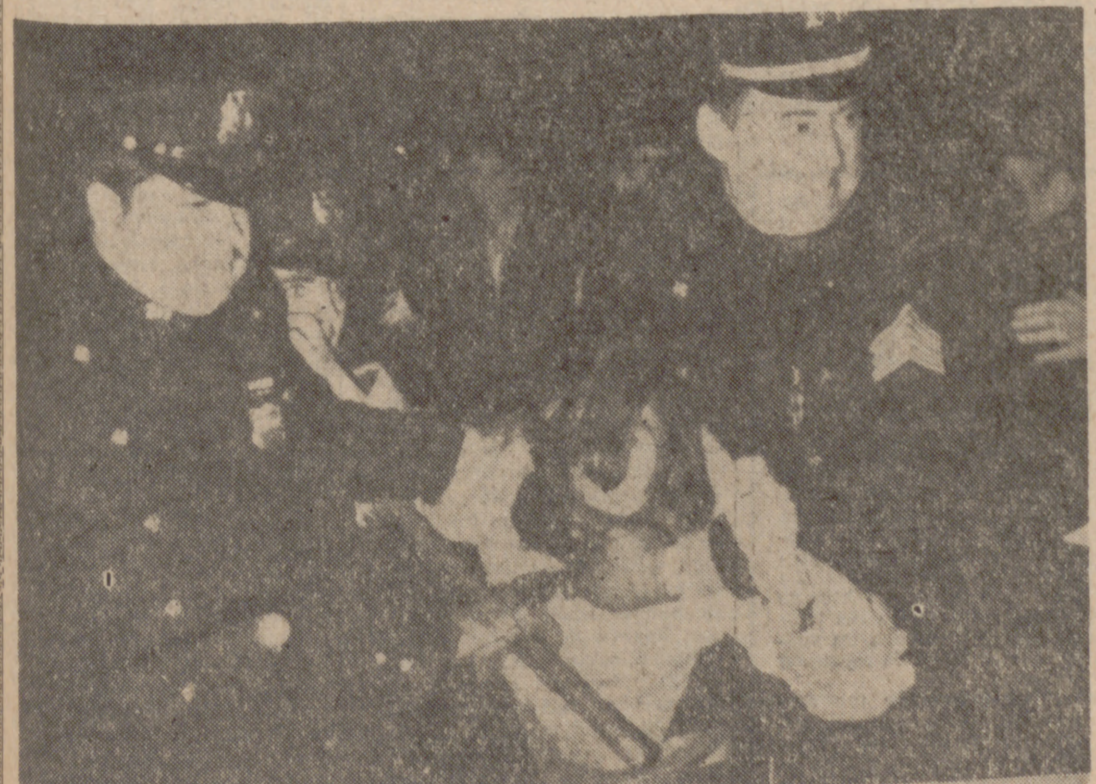
NUEVA YORK.—La Policía detiene a uno de los manifestantes durante los desórdenes que se produjeron fuera del Hotel Waldorf Astoria, donde el Presidente Nixon hizo acto de presencia para recibir la recompensa de "Americano Distinguido" de la Fundación Nacional de Fútbol. Cuarenta y dos personas, por lo menos, fueron arrestadas.