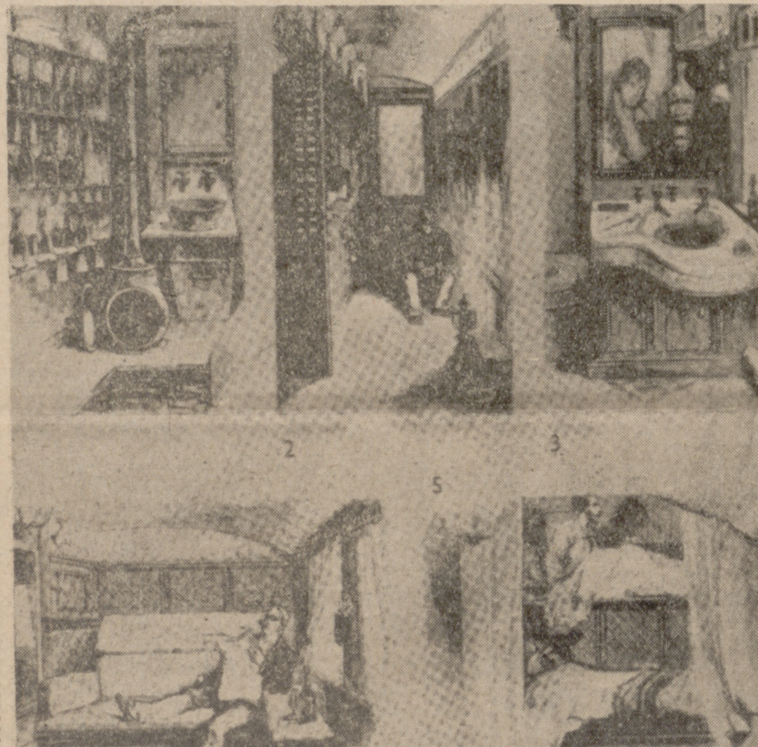
Las ventajas del coche-cama, ilustradas para mejor comprensión del viajero.

—Pues claro que sí— confirmó el joven defensor de las camas en los ferrocarriles, que no era