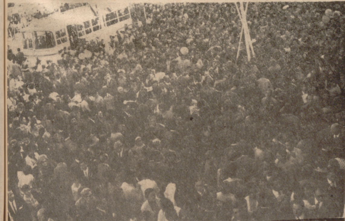
Impresionante aspecto de la afluencia de público a la Feria de Muestras en la tarde de ayer.

El Director General de Agricultura procedió a imponer las condecoraciones, concedidas por el Ministro de Agricultura a los ingenieros agrónomos, jefes comarcales de Ordenación Rural, don