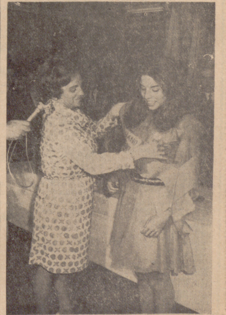
Le “Reina Butano 1969” recibe la banda acreditativa.

Finalizado el concurso, todos los invitados y las participantes fueron obsequiados espléndidamente por “Butano, S. A.”.