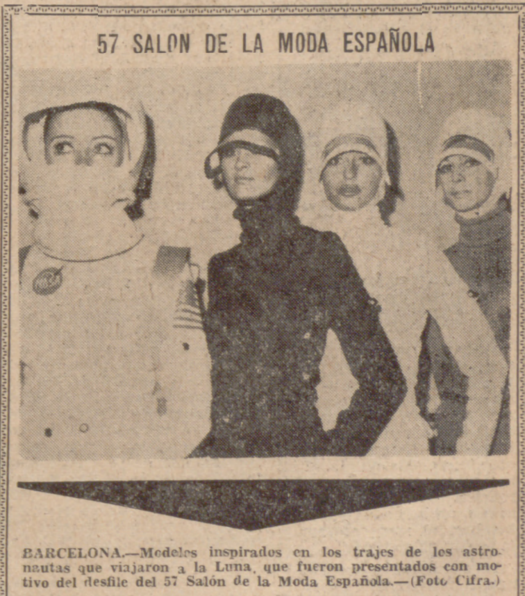
57 SALON DE LA MODA ESPAÑOLA. BARCELONA.—Modelos inspirados en los trajes de los astronautas que viajaron a la Luna, que fueron presentados con motivo del desfile del 57 Salón de la Moda Española.