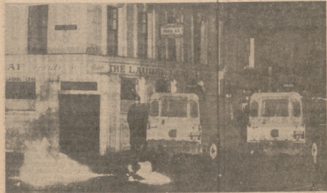
BELFAST.—Nuevos disturbios y violencia en esta capital entre la Policía y los integrantes de la manifestación en pro de los derechos civiles que recorrió la zona de Falls Road. Dos «cocteles Molotov» arden ante unos vehículos de la Policía durante los incidentes registrados en esta zona de Falls Road.

LONDRES.—(Del corresponsal de PYRESA, ANTONIO CASTRO).—La noche para la violencia de los agitadores y el día para las negociaciones de los políticos.