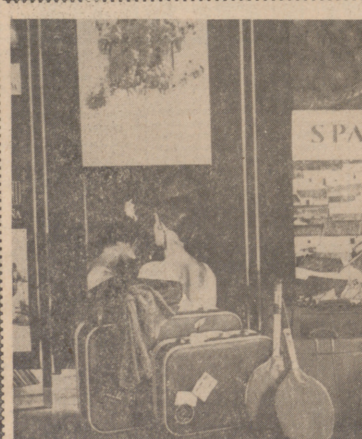
España, gran meta del turismo internacional.

Claro que hay personas que son alérgicas al turismo. Desde los que lo consideran una demoníaca manifestación del averno, que infecta las buenas costumbres, y que ante los beneficios que la industria del turismo produce, se muestran cautas y sublimas: ¿Qué sucederá el día que los turistas dejen de visitar España? ¿Y si se produce una guerra? ¿Y si una epidemia diezma la población del mundo? ¿Y si nuestro planeta es invadido por seres extraterrestres? En su concesión al asfalto, con añoranzas anacrónicas, se preguntan cuál será la solución del mañana si la industria turística hace crisis. Pero frente a esa escéptica postura ante el futuro, cabría preguntarse también que para qué se instalan fabricas de automóviles, complejos siderúrgicos, astilleros, centrales de energía atómica... ¿Ni faltan las que se autocalifican personas de ideas avanzadas, pero que caminan por el mundo con los prejuicios de un