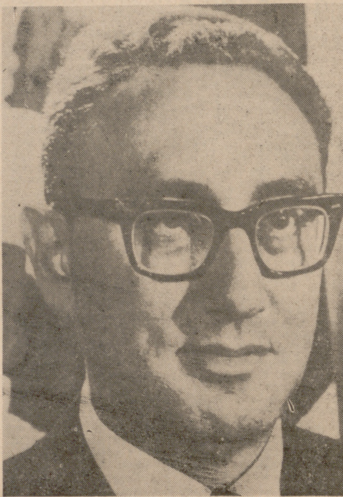
INSPIRADOR DEL PRESIDENTE

que no han sido nunca demasiado fijas, Kissinger ha servido ya bajo dos Administraciones y estuvo junto a Rockefeller en la primera parte de la pasada campaña presidencial.