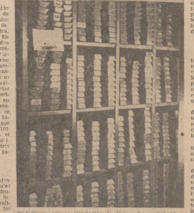
El turismo, con su aportación de divisas, ha contribuido a aumentar las reservas oro del Banco de España.

El aguismo, como industria tiene aún un ríscueto porvenir, a poco que se sepan explotar esas fuentes de salud. En suma, los viajes, sobre todo gracias a las posibilidades de transporte que se ofrecen en nuestro tiempo, no sólo nos permiten conocer mejor a los pueblos y a los hombres, sino que, además, enriquecen nuestra cultura, tonifican nuestra salud y levantan nuestro espíritu. Hay