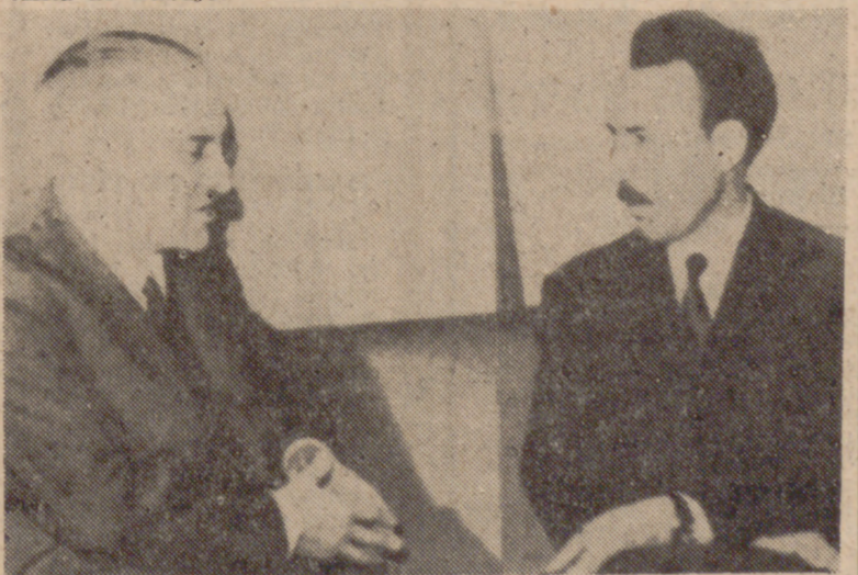
ARGEL.—El Presidente de Argelia, Houari Boumediene (derecha) durante la visita efectuada por el ministro español de Asuntos Exteriores, don Fernando María Castiella, con motivo de la visita oficial de éste.