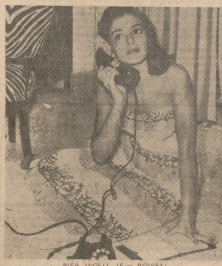
PIER ANGELI.