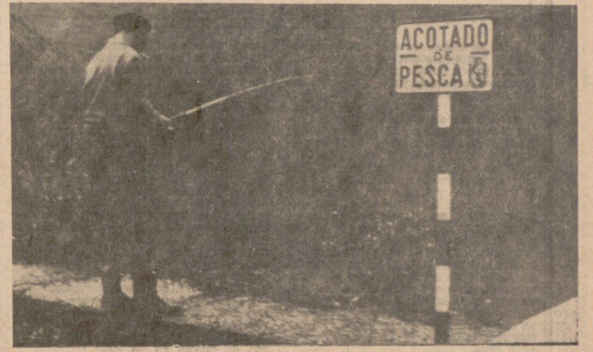
El Coto de Pesca Deportiva de Berastegi (Guipuzcoa).

De unos años a esta parte se va haciendo más corriente observar en nuestros viajes por las pistas de asfalto unos letreros que llaman esas pistas de agua llamadas cotos. Se trata de unas placas en las que se puede leer «acotado de pesca».