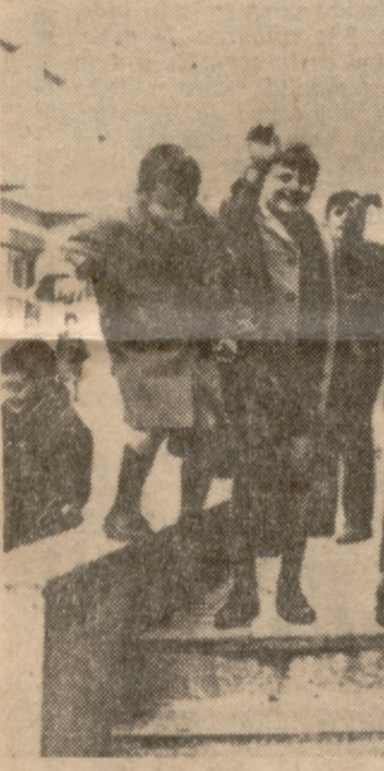
HOMBRES DE MUCHA CABEZA

tienen millones de lombrices de tierra en el estómago, y para alimentarse tienen que comer millones y millones de tierra para cebarlas por la boca y por las narices. De donde se deduce que hay que enviar a Biafra son purgantes.