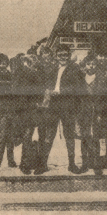
Hemos llegado al origen de una frase hecha. Es aquella que nos hace exclamar: «Tienes menos cerebro que un mosquito»