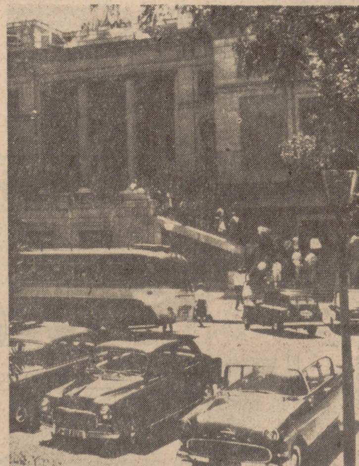
Cerca de un millón de personas visitaron el Museo del Prado el año pasado.

inauguró hace siglo y medio, fue diseñado por el gran arquitecto neoclásico Juan de Vill-