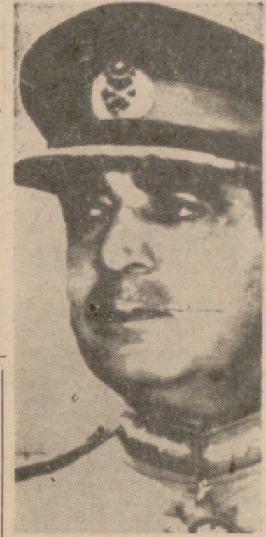
KARACHI.—Foto de archivo del general Agila Mohammad Yahya Khan, que ha asumido el control del Pakistán después de la dimisión del Presidente Ayub Khan.

KARACHI, 27. (Efe-Upi).—La ley marcial y la amenaza de energicas medidas contra los agitadores han restablecido la calma en amplias zonas del Pakistán. Las ciudades más populosas, por primera vez en cinco meses, han conocido condiciones casi normales. Millares de ciudadanos han entregado sus armas y municiones. Una vez más el tráfico normal ha vuelto a circular por las calles atestadas de Karachi, la ciudad más importante de la nación que durante semanas había sido azotada por oleadas de jóvenes perturbadores que protestaban contra el régimen, de Mohammed Ayub Khan. En "jeeps" las tropas iban patrullando por las calles en equipo de campaña. Largas hileras de pakistaneses se han presentado en las Comisarias de Policía de Karachi y en el distrito de Liaquatabad para la entrega de municiones, en obediencia al decreto de la ley marcial, que concedía un plazo de veinticuatro horas para hacerlo. El plazo ha sido ampliado otras veinticuatro por haber sido gran número de personas las que han respondido al llamamiento. También se ha señalado la tranquilidad en otras ciudades a raíz de la dimisión de Ayub Khan como Presidente, después de su nombramiento del general A. A. Yahya Khan como jefe de Gobierno con el título de administrador de la ley marcial. (Pasa a la página siguiente)