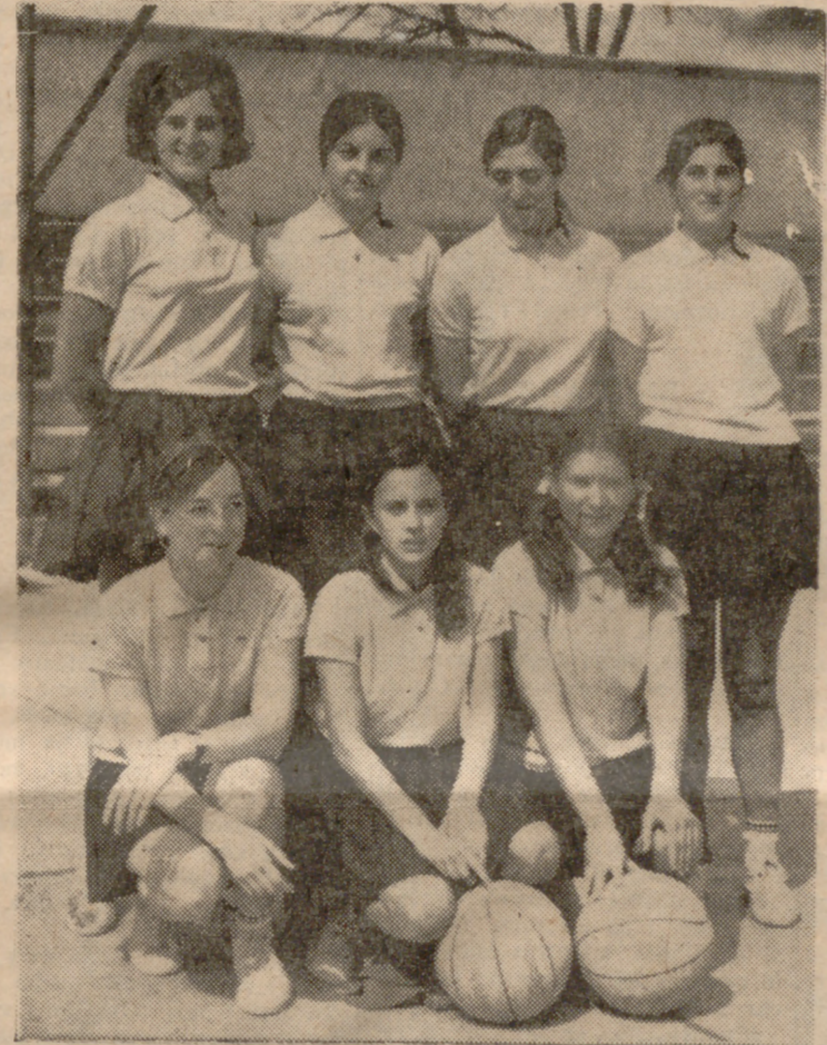
El equipo vallisoletano, brillante vencedor de la fase de ascenso a Primera División.

trunfo, ante el equipo de Palencia, 63-10 señalaba el marcador final, y a fe que pudo ser un tanteo de escándalo, como ya lo había sido ese espectacular 45-2. Luego, tras