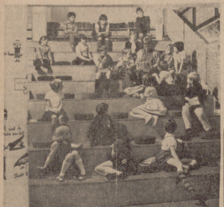
STUTTGART.—Una atracción peculiar para los "bibliómanos" más pequeños la constituye esta escalera de lectura, en la que pueden estudiar tranquilamente los libros de cuentos y de estampas o escuchar a la joven que les lee en voz alta unos cuentos...