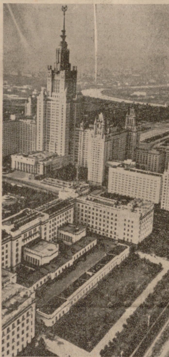
Perspectiva de la Universidad de Moscú.