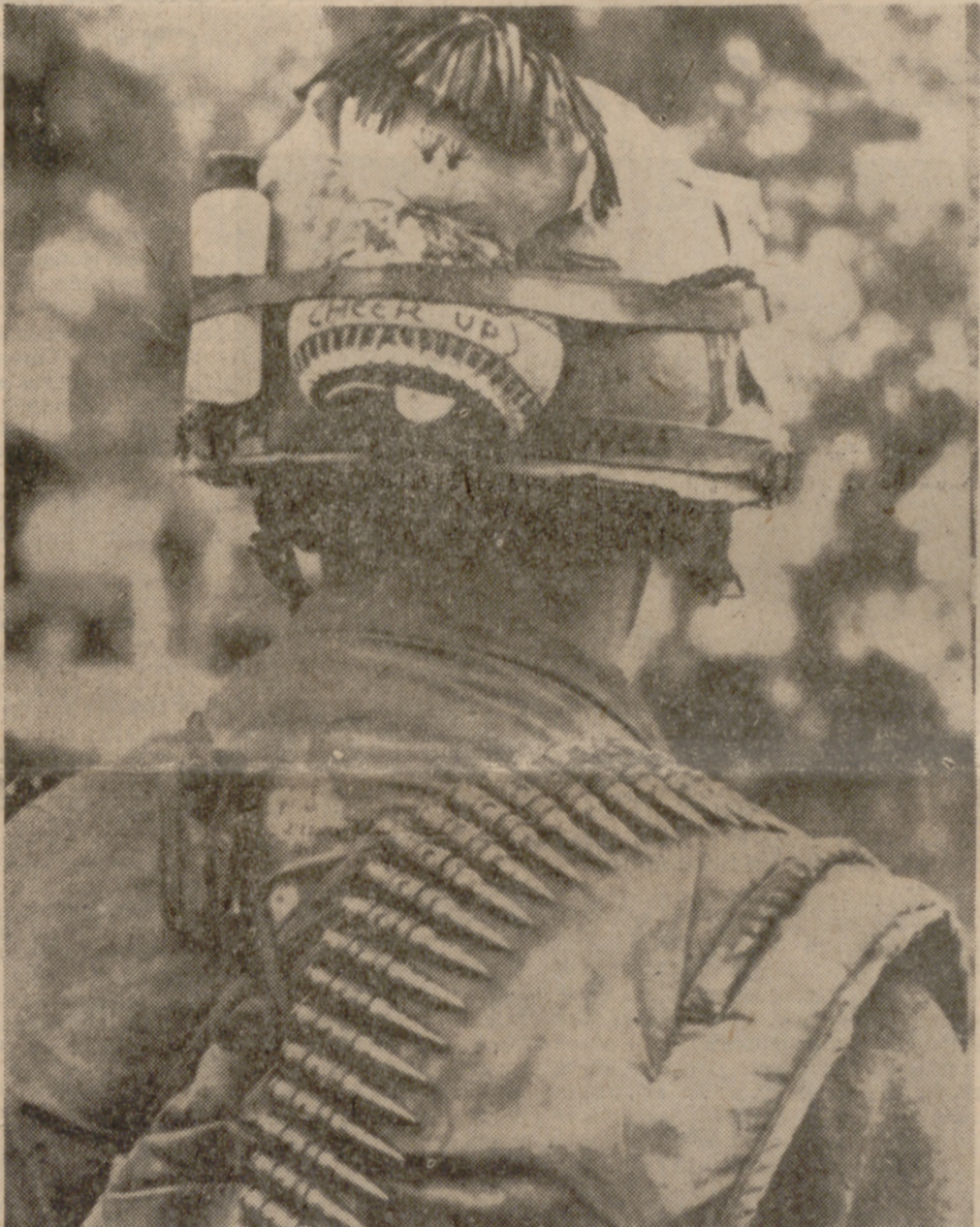
HUE (Vietnam).—Un muñeco de recuerdo con el letrero de "¡Animo!" adorna el casco de este "marine" de las fuerzas norteamericanas que combaten en esta ciudad.—(Telefoto Upi-Cifra.)

En la Diputación, con asistencia de autoridades de aquella provincia y de la nuestra