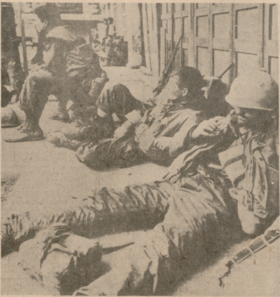
HUE (Vietnam).—Sin perder la cara al enemigo, estos soldados norteamericanos se recuestan sentados sobre la pared de una calle en un pequeño descanso en los encarnizados combates, casa por casa, que se vienen registrando en esta ciudad.