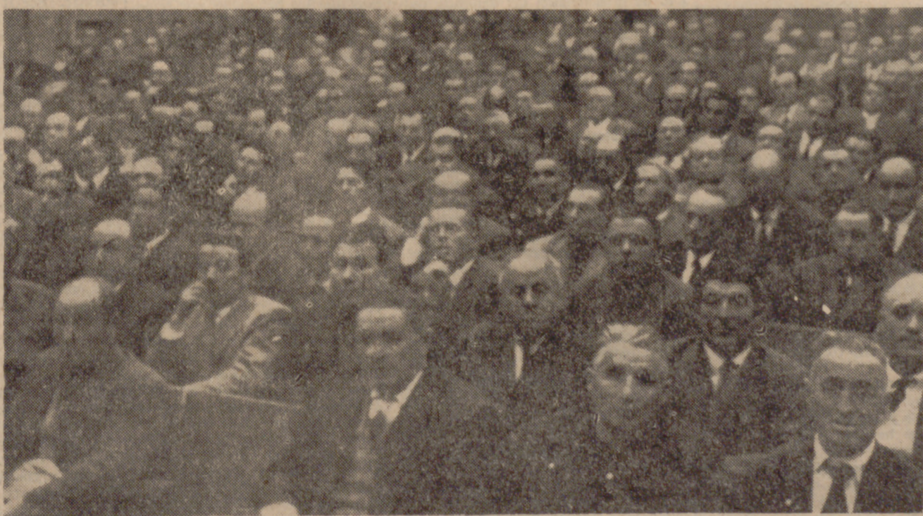
UN ASPECTO DEL SALON DE ACTOS DE LA CASA SINDICAL

Esta mañana, después de las once, Asamblea Plenaria de la Cámara Oficial Sindical Agraria, en el salón de actos de la Casa Sindical, lleno y hasta abarrotado. Los temas campesinos son de encendido interés. Se van a tratar problemas, arribando soluciones para ellos. Los más acuciantes son los relativos a plantaciones de viñedo, precio y almacenamiento de cereales, Mutualidad de Previsión Social Agraria, Seguridad Social para empresarios agrícolas y autónomos no incluidos en dicha Mutualidad y anteproyecto de la Ley de Caza, actualmente sometido a información pública.