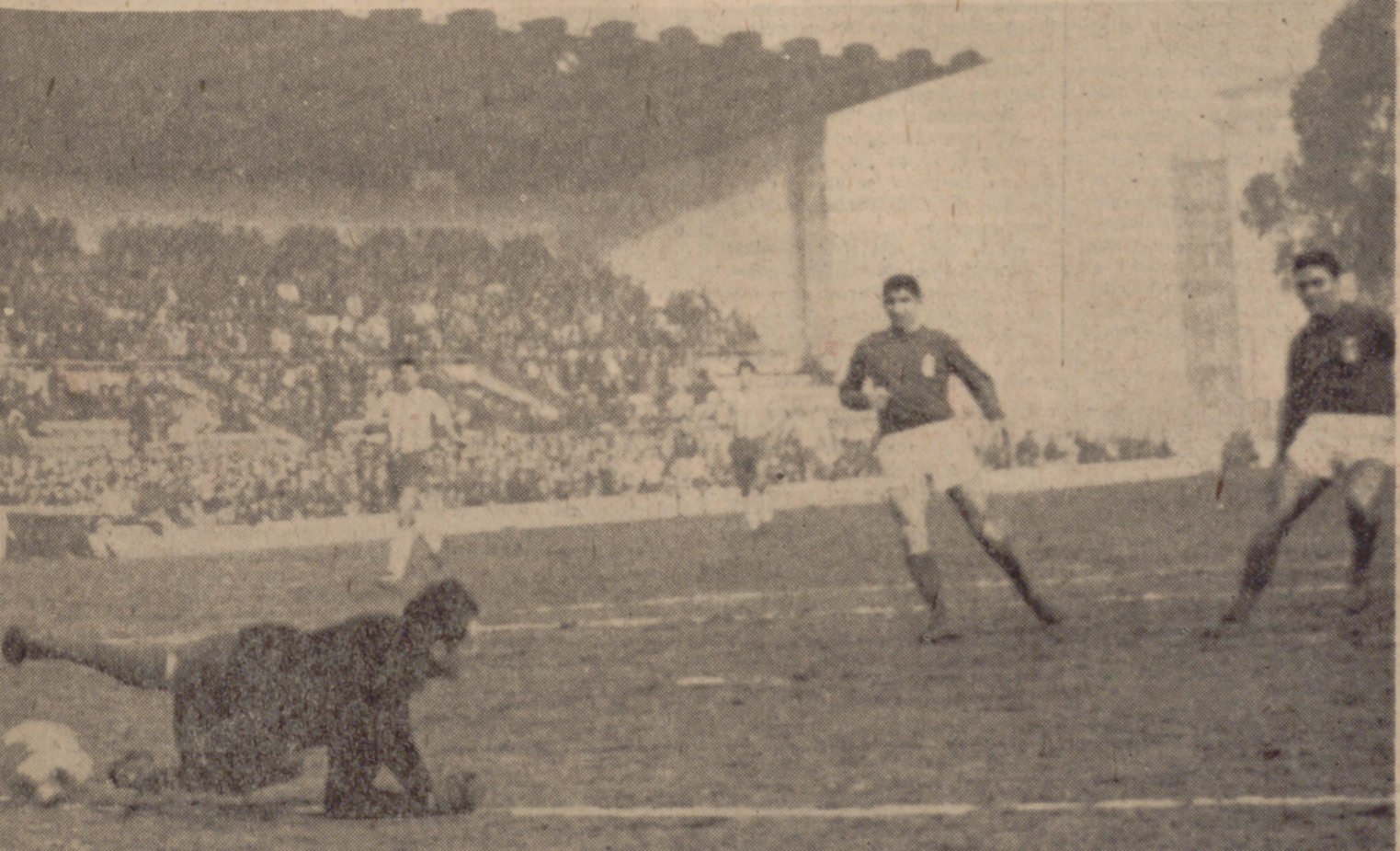
PRIMER GOL.—Antes de los siete minutos de juego ya estaba en el casillero el primer gol del Valladolid. Una escapada fulgurante de Quique, pase atrás medido y remate de Román sobre la marcha. Pocheco pondría algo de su cuenta, lanzándose tarde, pero hubiera sido injusto que jugada como la del zaguero vallisoletano se hubiera malogrado.