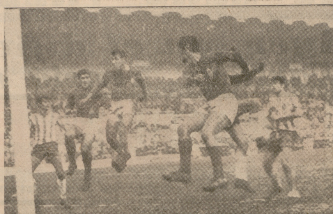
A POR EL EMPATE.—El Oviedo atacó con fuerza y decisión en muchos momentos. Achuri, Quirós y Azurmendi, la tripleta central, se lanzan en tromba, pretendiendo rematar un balón que terminaría siendo alejado por los puños de Aguilar.