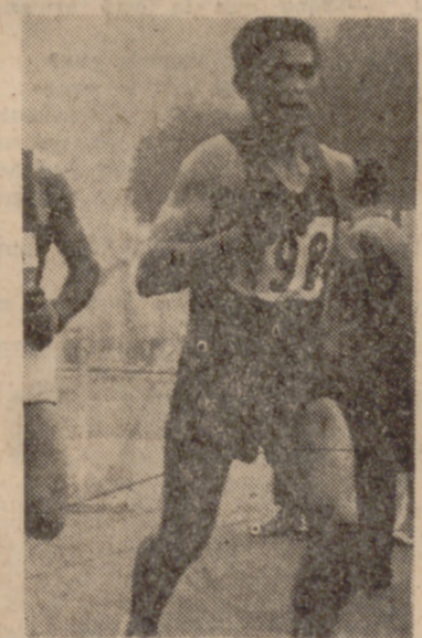
SAN BLAS, 11