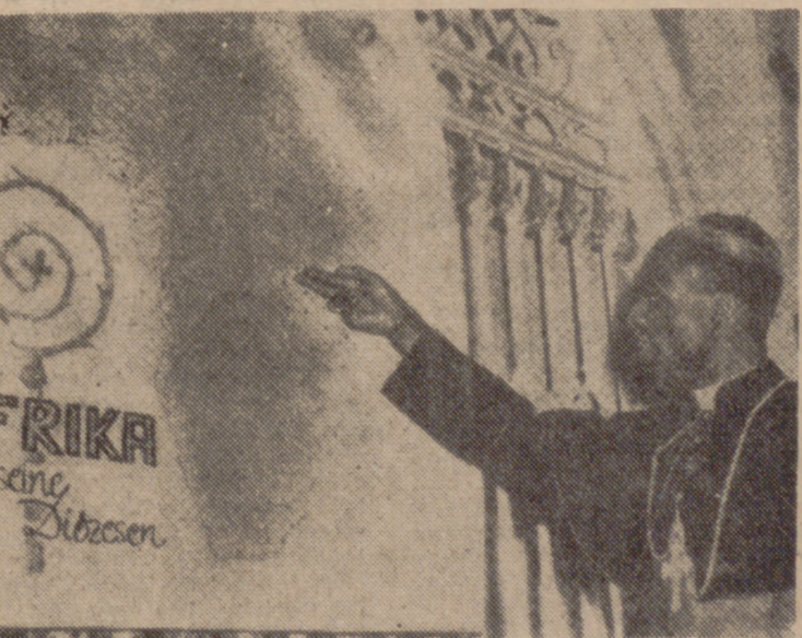
El cardenal negro africano, Laureano Rugamwa, señalando los avances de la Iglesia Católica en África.