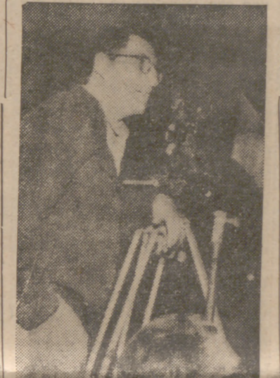
Bardem, autor del film «Los pianos mecánicos», aun no ha estrenado en Valladolid.

Así, mujer, juventud y deporte han evolucionado de forma positiva en 1966, al ritmo del progreso registrado en cuantos capítulos integran la vida nacional, y nos depa- rará un buen ejemplo de la efunda conquista del mañana que, paso a paso y día a día, subraya todos los cauces de nuestra andadura hacia el destino histórico que nos corresponde.