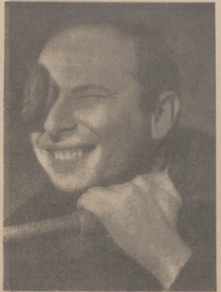
Summers, autor de «Juguetes rotos», película de tono tremendista, presentada en la XI Semana Internacional de Cine Religioso y de Valores Humanos.

La muerte de Walt Disney cierra el año con tristeza