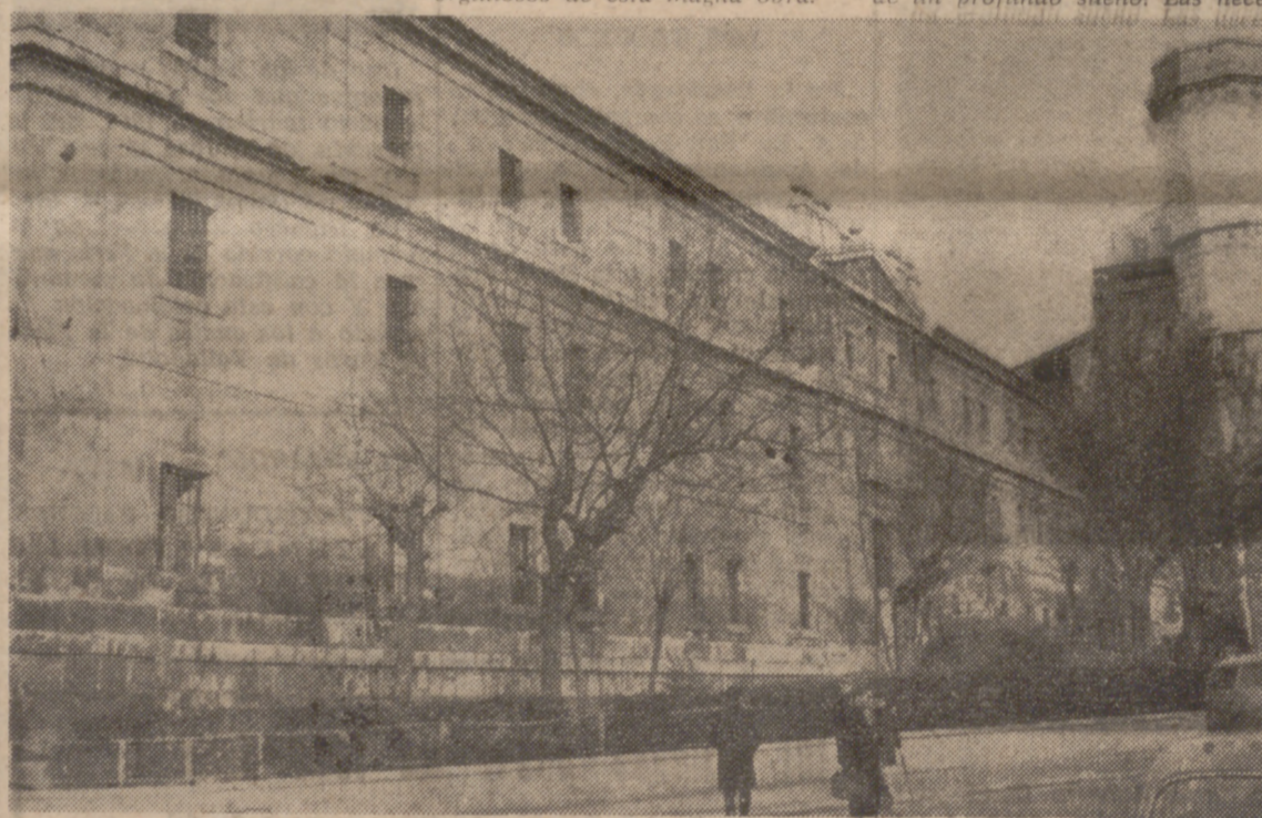
Definitivamente, el antiguo cuartel de San Benito pasó al Ayuntamiento.

la tarde del día 14 de abril, unos camiones arrastran tras de sí los pilares que sujetan la techumbre y