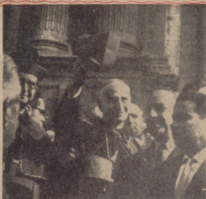
Monseñor Herrera, eminente cardenal español, que ha renunciado a su cargo de obispo de Málaga para dedicarse a la dirección de obras de carácter social.

España, sin embargo, es la nación portaestandarte en seguir las doctrinas de la Iglesia, y en