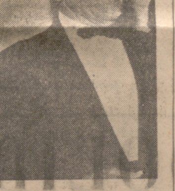
Wyller, autor de «El coleccionista»

En nuestra ciudad hay seis o siete salas en las que se proyectan películas de estreno. Esto quiere decir que, semanalmente, por regla general, conocemos seis nuevos títulos. Echen ustedes la cuenta, y tendrán el número aproximado de estrenos que ha habido en el año que se va. Pero como más que la cantidad importa la calidad, vamos a limitarnos a mencionar las cintas de interés llegadas a nuestras pantallas en este período de tiempo.