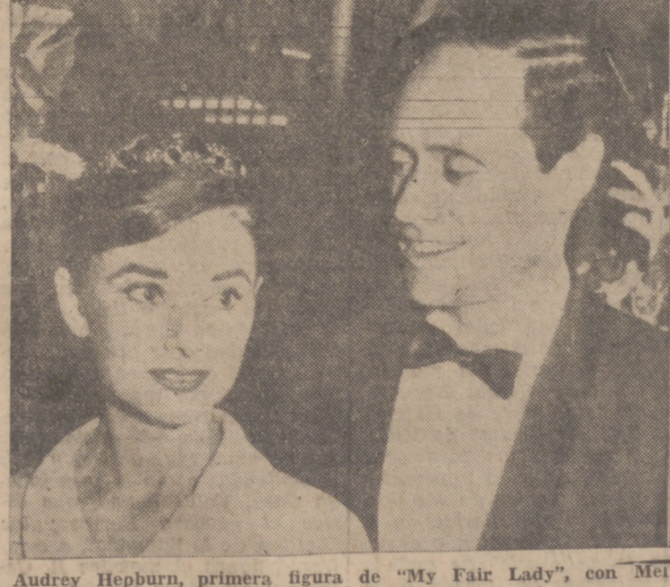
Audrey Hepburn, primera figura de «My Fair Lady», con Mel Ferrer, su marido.

Crecido haber diario en mano aumentando por años de servicio. Primas de enganche comida y masita para vestuario. Permisos de recenganche: Cada seis meses, 15 días; cada año, 40 días, y con viajes al punto elegido abonados por el Estado. Permisos extraordinarios justificados.