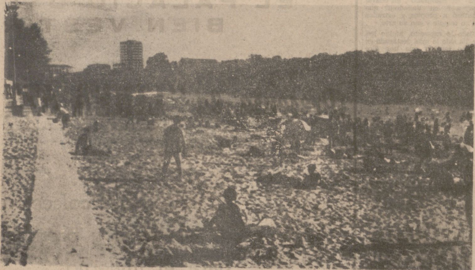
LA PLAYA, EN PLENA TEMPORADA ESTIVAL

El Paseo de Zorrilla, el de Isabel la Católica, la playa y la toma de posesión de los antiguos cuarteles, notas destacadas La proyección futura de la ciudad y la Ciudad Polideportiva, ambiciosos proyectos