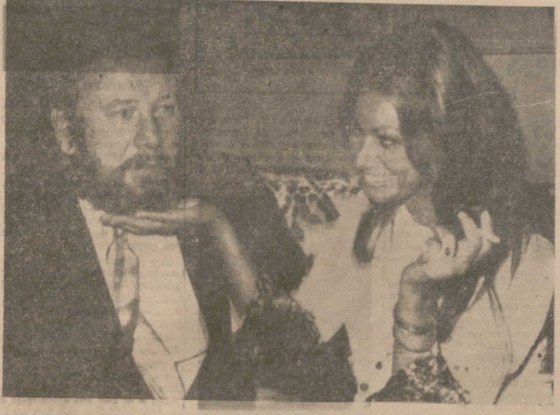
Sofía Loren, impresionante protagonista de «Arabesco», aparece en la foto en compañía de Peter Ustinov durante una recepción en Nueva York.