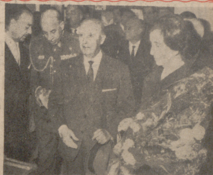
El Caudillo y su esposa, votando en el referéndum en el que masivamente los españoles aprobamos la Ley Orgánica del Estado.

E l día que se aprobó en las Cortes Españolas la nueva Ley de Prensa, abundaron fuera y dentro de nuestras fronteras las tendencias opinativas radicadas en el puro escepticismo. Pensaban unos, los de fuera, que todo seguiría igual que hasta el presente. Temían otros, los de dentro, que pudiera desbocarse este alado "Pegaso" puesto en manos de nuestros medios informativos. Pero han pasado ya varios meses y la respuesta de la práctica, inequívoca y reconfortante, ha sido adversa para ambas extremas posturas. En cuanto a los primeros, porque una brisa renovadora se ha dejado notar en nuestros cauces difusores, atentos siempre a la crítica constructiva, a la denuncia oportuna y, en definitiva, al culto de la verdad. En relación con los del segundo grupo, los que han merecido el calificativo de "timoratos", porque las aguas no se han salido de sus cauces y apenas se ha producido alguna muy contada nota discordante que no vale a la ho-