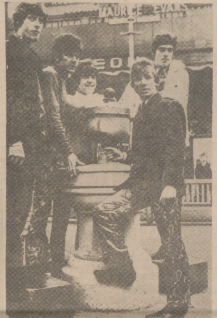
Dave Dee, Dozy Beaky, Mick y Tich son un quinteto de jóvenes "showmen" que han resuelto el problema de buscar un nombre profesional al designarse con el de cada uno de ellos.