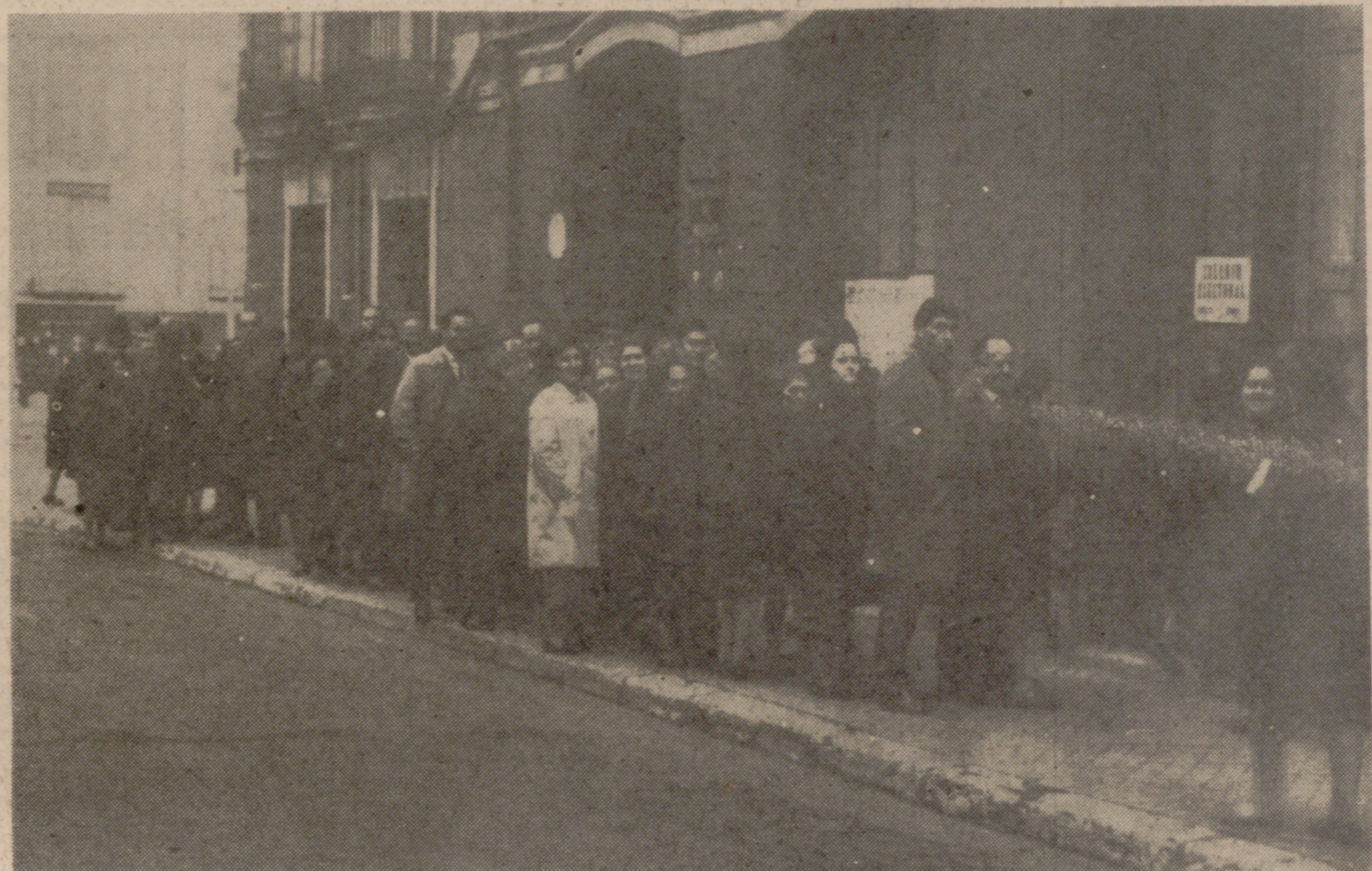
Una de las numerosas y compactas "colas" formadas desde las primeras horas de la mañana en todos los colegios electorales de la capital.

Durante toda la mañana y primeras horas de la tarde, hemos venido recibiendo una amplísima información, desde todos los puntos de España, en la que se pone de manifiesto el carácter plebiscitario del referéndum sobre la Ley Orgánica del Estado. A primera vista pudiera parecer esta afirmación una profecía optimista, puesto que se trata de votación secreta unipersonal, pero el entusiasmo se desborda en tal manera, que a veces—como en esa noticia de Alicante—, el "Vi-