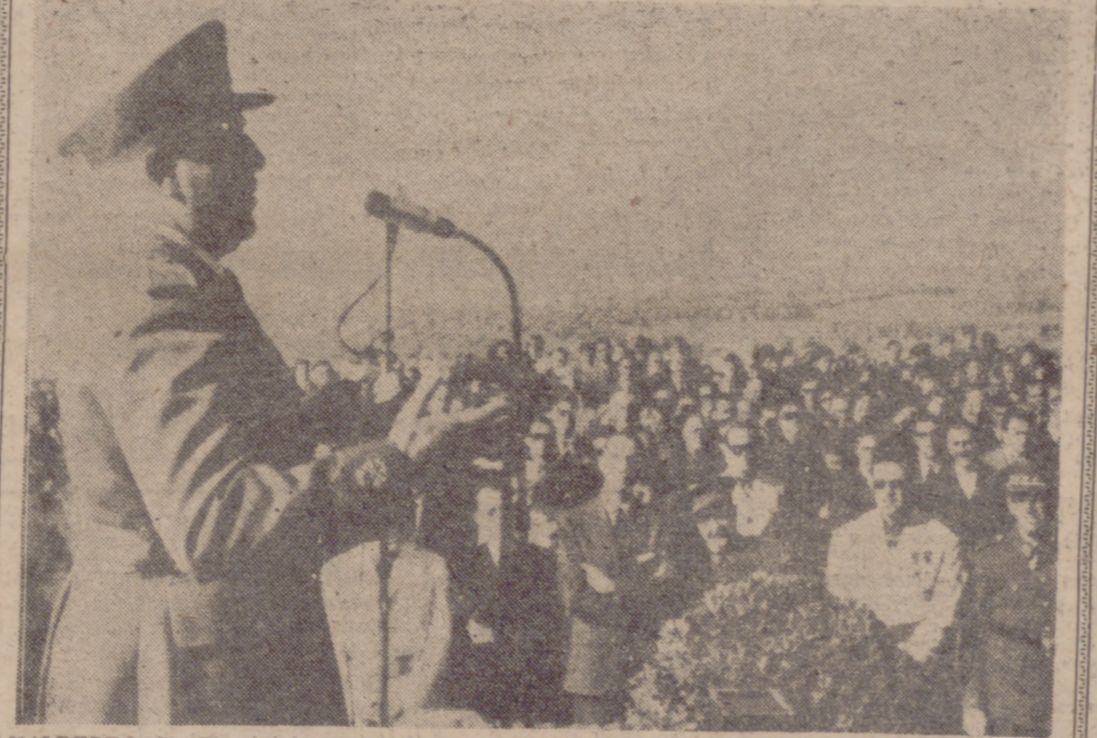
VALDEPENAS.—El ministro de la Gobernación, don Camilo Alonso Vega, ha inaugurado en el Cerro de las Águzaderas el monumento que la provincia de Ciudad Real dedica al Caudillo de España, Francisco Franco, y como homenaje de gratitud y perpetuo recuerdo a sus mártires de la Cruzada. El Ministro de la Gobernación pronunció un discurso en el que, en encomiosas palabras, exaltó la gesta de la Cruzada y los veinticinco años de paz que estamos viviendo. En la "foto", el Ministro de la Gobernación durante su discurso.