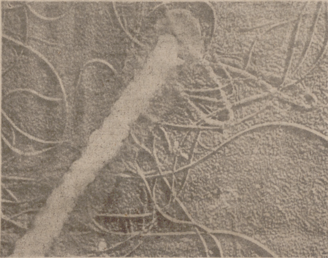
Una bacteria de las leguminosas aumenta su tamaño real 50.000 veces. Los filamentos que parten de ella son "pestañas" o "cilios". Las bacterias móviles se hallan en medios líquidos y se desplazan agitando esos apéndices cilíndricos como remos.

Quite durante los últimos años la microbiología ha