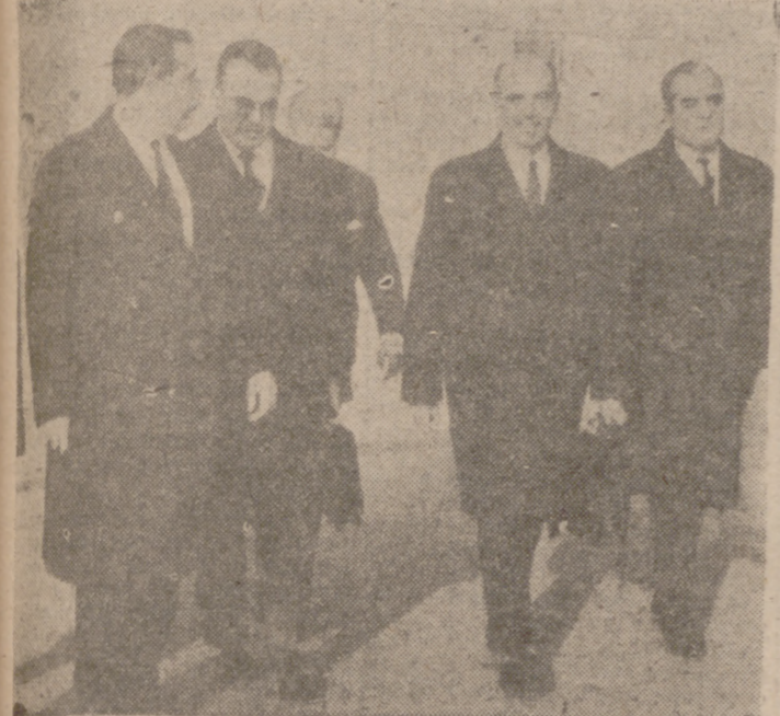
Solis Ruiz, al frente de una delegación parlamentaria española que durante estos días mantiene conversaciones con diversos parlamentarios franceses. En la "foto", un momento de la salida hacia París.