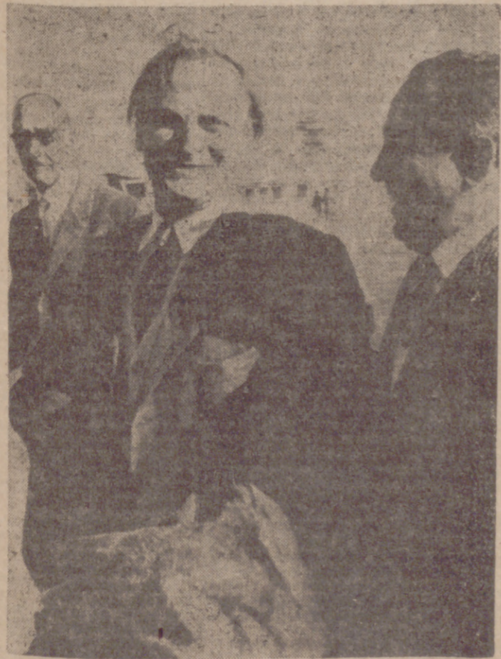
BARCELONA.—El famoso violinista Yehudi Menuhin, a su llegada al aeropuerto del Prat.