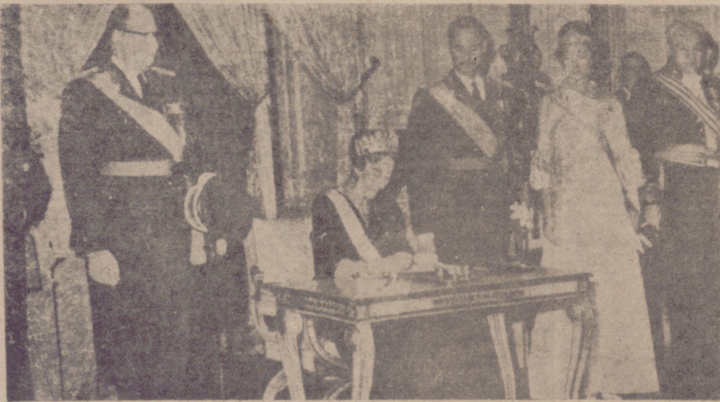
La Gran Duquesa Carlota de Luxemburgo firma el acta de abdicación que eleva a Gran Duque a su hijo Juan. De pie, de izquierda a derecha, su esposo, el príncipe Félix, el nuevo Gran Duque y la Gran Duquesa Josefina Carlota.