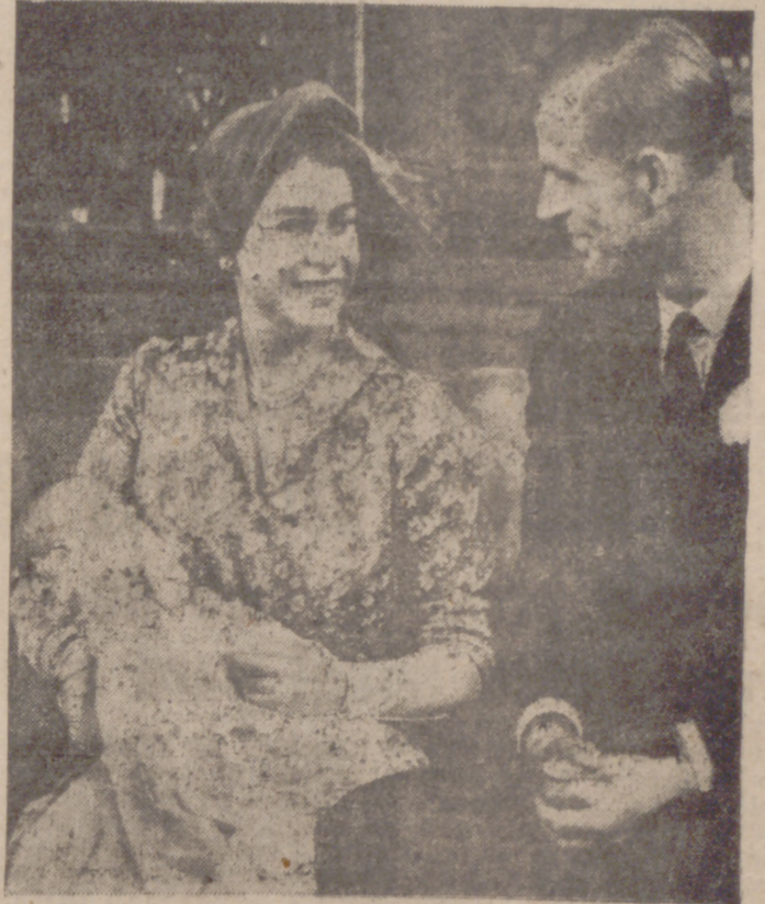
La reina Isabel II de Inglaterra, con su esposo Felipe y el heredero del trono, cuando tenía muy pocos meses de edad.

Conocida desde siempre la Reina Madre como una discreta y gran señora, su ex-cocinera nos lo confirma descubriendo que en ocasiones había retrasado la comida por no cortar a sus huéspedes el degustar