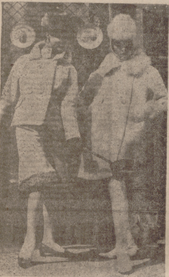
Un extracto del desfile de invierno, del célebre creador de modas Heinz Schulz-Varell, de Munich: un vestido con pantalones de tejido de estambre con aplicación de astracán, para salir de compras, y un abrigo de tweed desmotado, con dos hileras de botones, con polainas y aplicación de piel de mar-ta blanca.

HAMBURGO.—Terminaron las grandes y pequeñas exhibiciones de vestidos y los desfiles de modelos para el invierno 1964-65. Los escaparates están decorados para el otoño. Las señoras se preparan para los días más frescos. Todo lleva a creer que en este invierno se envolverán, de la cabeza a los pies, en pieles. Jamás la moda se ha abandonado tanto al goce de las pieles como este año. Los costureros en Munich, en Berlín, en Hamburgo y en Düsseldorf recurrieron a pieles preciosas, al mandar maniqués subir a las pasarelas con los maravillosos vestidos de gran gala. Forraron conjuntos de esquí y abrigos con pieles de visón; crearon vestidos con pantalones de pieles de breitschwanz, para las noches al amor de la lumbre; aplicaron chinchilla y astracán a pantalones cortos, hasta las rodillas, usados con vestidos extremadamente sencillos; incluyeron en sus colecciones sombreros, corbatas, cuellos y mangos de pieles de todos los tipos.