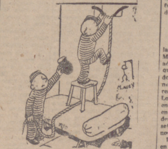
—Llévate el tarro y así descubrirás que saltas a buscar agua.