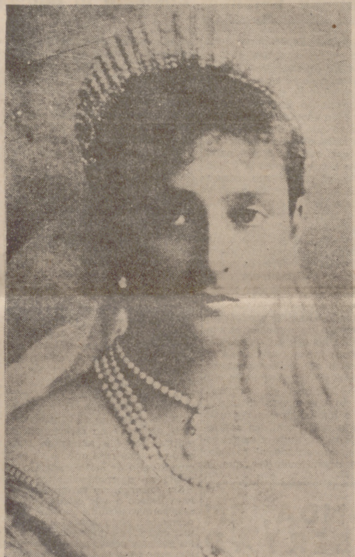
La emperatriz Alejandra Feodorovna, esposa del zar Nicolás II de Rusia. Se la consideraba la mujer más bella de Europa. La prisión y más tarde la fuga y las humillaciones del destierro y el hambre, minaron la salud de Alejandra. Su hijo ha dicho: "Mi madre murió de hambre." Murió en Varsovia, donde está sepultada bajo nombre supuesto en el Cementerio público.

En la órbita diplomática también las cosas tienen su precio. Esta medida de prestigio Francia tendrá que pagarla con una cuota de aislamiento. Los norteamericanos, según noticias oficiales, están absolutamente decididos a conseguir que la fuerza multilateral sea el instrumento base de la Alianza Atlántica. Dentro del círculo, evidentemente, no cabrá un Ejército con propio armamento y autarquía operacional y de decisión; queda entendido que los franceses serían nación aparte. Antes de resignarse a dividir la Alianza en dos grupos—dicen los especialistas—. Estados Unidos preferirá retirarse sus fuerzas y establecer alianzas bilaterales con cada uno de sus aliados, renunciando al bloque europeo, unido hasta ahora por este pacto defensivo.