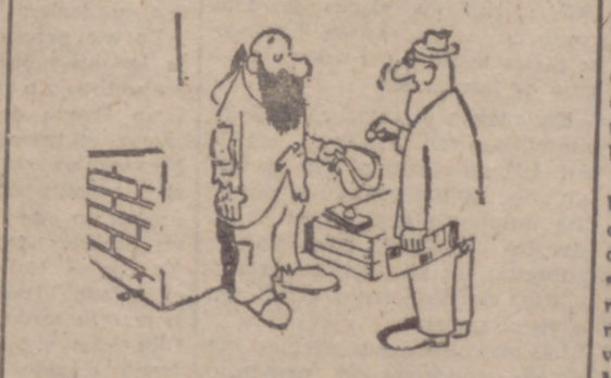
—Hoga es favor de hacerme un recibito.

(SOLUCION AL CRUCIGRAMA EN LA SECCION DE ANUNCIOS ECONOMICOS)