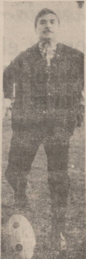
Los años pasan, pero el estuo permanece...