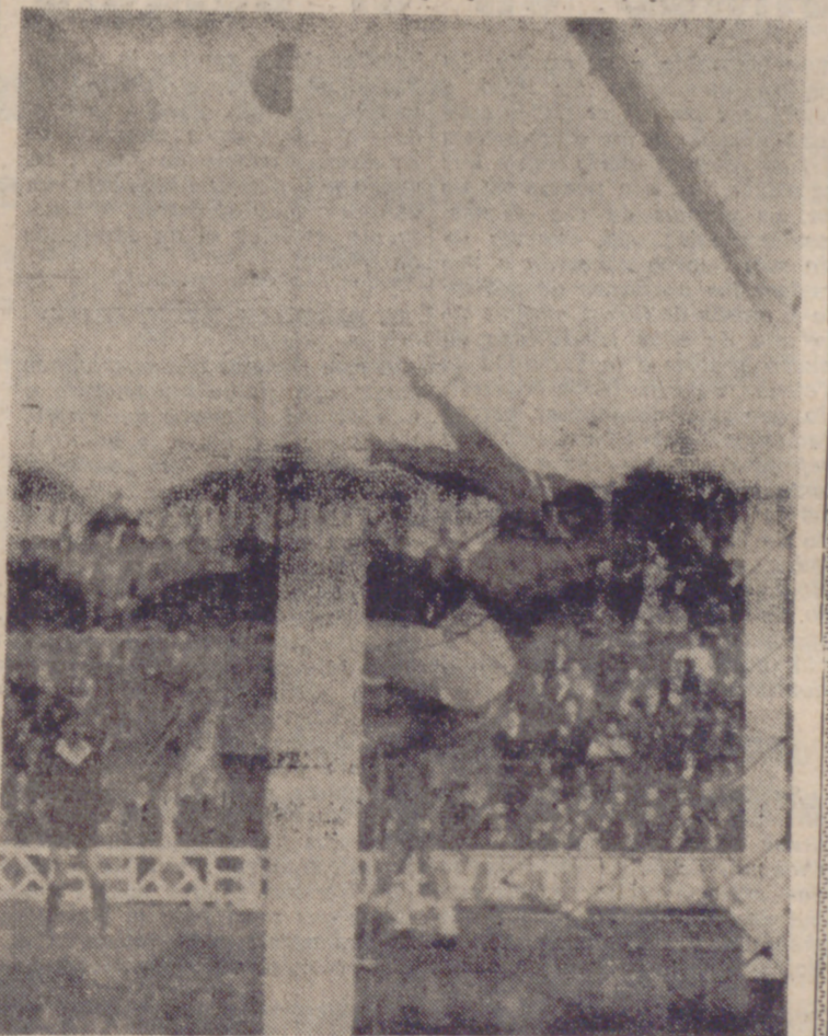
BIEN, COBOS.—El meta visitante fue uno de los buenos de su equipo. El despeje es un testimonio.

Si todo el encuentro, en líneas generales, fue entretenido, nos quedamos con la primera parte, porque en ella, plétreicos de