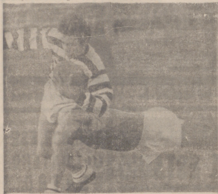
ESTO ES EL RUGBY.—Belleza y emoción; éste es el rugby que ayer se jugó en la Challenge «Pepe Hurtado». Si el público lo hubiera visto, el rugby no sería un deporte de minorías.

Fue un gran espectáculo. El rugby estuvo en la tarde del domingo con toda su belleza plástica, con toda su emoción y su lucha. Cien muchachos, cien bravos del rugby mejor que se hace en España, dejaron en el terreno constancia de un deporte hermoso.