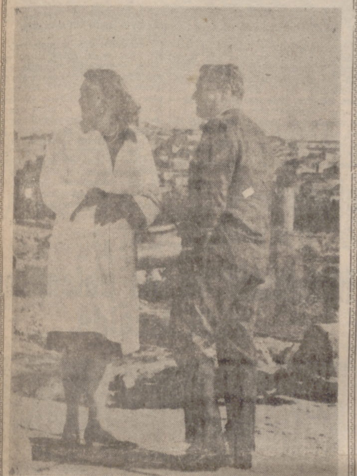
AVILA.—El gobernador del Estado de Nueva York, Nelson Rockefeller, acompañado de su esposa, Margarita, visita el lugar donde la tradición cuenta que Santa Teresa sacudió el polvo de sus sandalias.