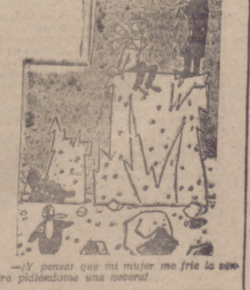
—Y pensar que mi mujer me fría la sopa, gra pidiéndome una neveral

de 1964 NE CIAS as 4,80 programa: hab a ssino ORRIBU y TORRENTE Color Dean Martín MacLaine MacLaine, años) ERON on el gran para film en O-AO as 4,80 y 1,45 LOREN BOYD en AIDA PERIO ANO RADA CION! DOMINGO ciones - 10,30 VEGA 5 y 10,30 SEMANA LITON! ERSON DE LATES!! MARIOS Color aine, Pau Martín, fu Gene (10) 18 años) ERA as 4,80 PROGRAMA ABLE!! ajo vivo en GLAS en DE LA RZA ada con de Ash LADAS) LIA DESDE LA LANANA DIA ony Cur Lemon en lds de loco riton en MATAR 18 años) TOY as 4,80 PECK en PU'SON! HUNTER en vio encio lecho años) ESTE DIAR DA INO ros TORY RLO en la ciudad OS) COCA ENO SACION EN A GO LLA CULAS DE A localidad