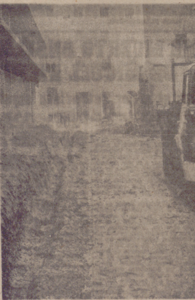
Han sido derribadas las tapas del nuevo tramo de la prolongación de la calle Marina de Escobar, que se extenderá desde la calle de Miguel Iscar a la de Gamazo. Como se ve en la foto, se han iniciado los trabajos de urbanización de la misma, alcantarillado y conducción de agua.