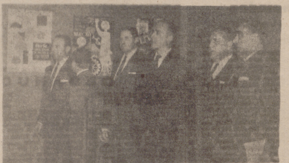
Ayer, en el salón de actos del Ayuntamiento, se celebró la inauguración de la exposición de carteles para el concurso para la elección del cartel anunciador del primer certamen de la Feria Regional de Muestras que se celebrará en septiembre del próximo año.