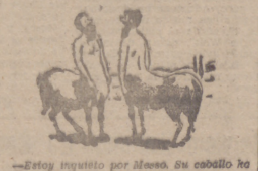
—Estoy inquieto por Meseo. Su caballo ha buetto pero él, no.

HORIZONTALES. — 1: Cierta comida. Cierta astro. 2: Plantas filíceas. Herramienta para coger tierra. 3: Al revés, colocar. Batracios. 4: Conocedores. 5: Al revés, cogieres con cepo o con alguna arma de fuego. 6: Al revés, remover algo con cucharas. 7: Probador. 8: Comisales por la noche. 9: Ciertos mamíferos que se caracterizan por ralar las tierras. Unir en matrimonio. 10: En plural, la amistad. Cierta habitación. 11: En plural, artículo. Pronombre. VERTICALES. — 1: Pareja. Cierta vela. 2: Estropeos. Cierta figura geométrica. 3: En femenino, impares. Ciertas trampas para cazar. 4: En plural, monarca. 5: Expertos. 6: Provincias. 7: Al revés, coladores, cribas. 8: Ciertas figuras geométricas. 9: Al revés, planta de la vid plural. Cierta planta de hoja espinosa. 10: Al revés, desamparados. Marcha. 11: En plural, artículo. Nivel. (SOLUCION AL CRUCIGRAMA EN A SECCION DE ANUNCIOS ECONOMICOS)