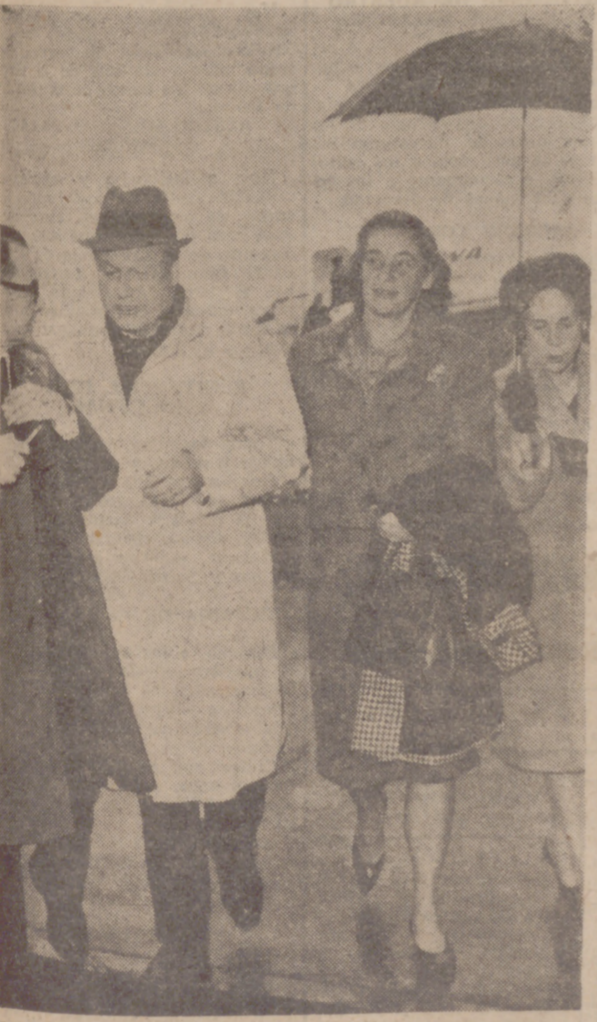
MADRID.—Un momento de la llegada al aeropuerto de Barajas del gobernador del Estado de Nueva York, Nelson Rockefeller, al que acompaña su esposa.