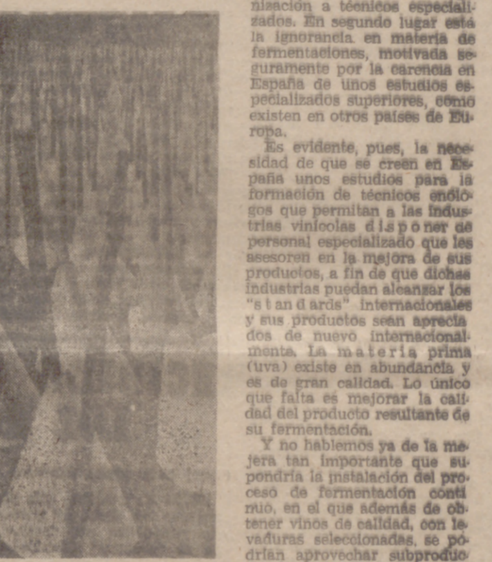
Parece una extraña concentración de fantasmas o una panorámica de menudas tiendas indias de campaña. Se trata, en realidad, de una técnica elemental y útil que se ha adoptado en Australia ante los grandes cambios de temperatura provocados por la inestabilidad del tiempo. Con cartones se han formado esos cucuruchos que protegen las cepas de los vides de las heladas.

do mejoras apreciables, otros países, como Italia y Francia, han mejorado mucho sus cualidades. ES NECESARIO MEJORAR LA CALIDAD Causas de la deficiente calidad de nuestros caldos son, entre otras cosas, la carencia