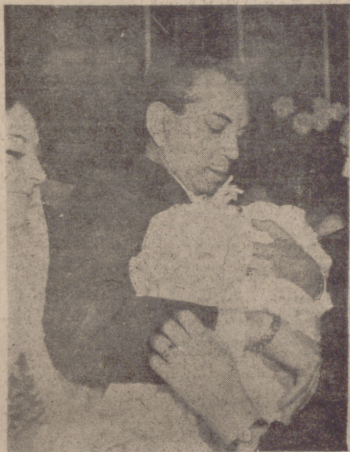
El popular "Cantinflas", con el gesto grave que requiere el momento, y que no nos recuerda en nada a esa cara de sorpresa y de intencionada picardía con que nos acostumbró en sus muchas películas, sostiene delicadamente en sus brazos a la hija de Alfonso Camorra, durante la ceremonia del bautizo de la neófita celebrada en la capital de España.