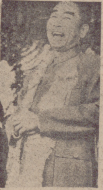
CHU EN LAI

factos bélicos exploten sobre las ciudades y sobre las cabezas de los hombres horrorizados, tal, por ejemplo, como ocurrió en las dos desgraciadas ciudades japonesas, Hiroshima y Nagasaki, en las postrimerías de la pasada gran guerra; algunas veces, la sola exhibición de las armas es suficiente. Ahora, en estas jornadas, ha bastado que los chinos de Mao demostraran que tenían la bomba atómica para que, casi de repente, pudieran coaccionar y pesar como si la catástrofe se hubiera producido.