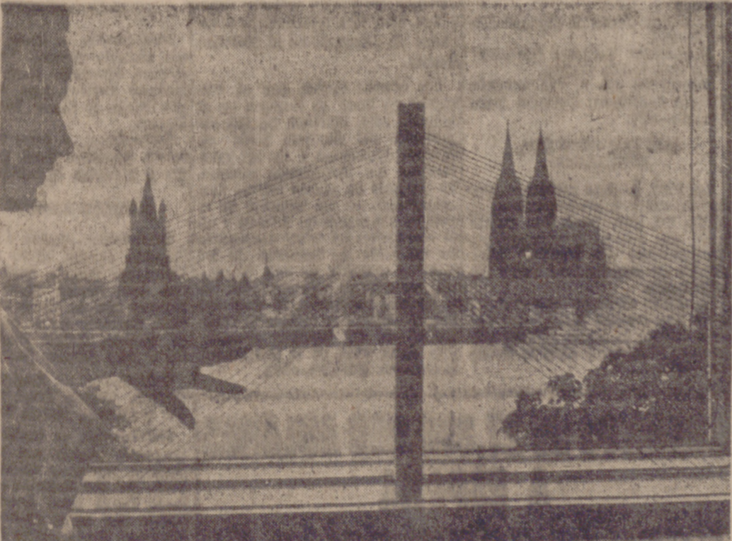
Música celestial escucharán los habitantes de Bonn cuando pasen, en dos años y medio, por el nuevo puente sobre el Rin y cuando el viento vaya a soplar fuertemente a través de los ochenta cables dispuestos a modo de arpa en los dos pilones centrales de 49 metros de altura, destinados para sostener el puente de 520 metros de largo. Este segundo puente sobre el Rin, cuya construcción se ha iniciado, estará destinado para enlazar el aeródromo de Colonia-Bonn con la autopista en la orilla izquierda del Rin. Sus gastos de construcción se han presupuestado en 21,3 millones de marcos.