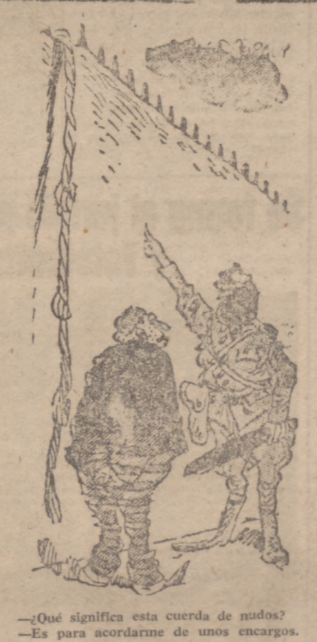
—¿Qué significa esta cuerda de nudos? —Es para acordarme de unos encargos.

HORIZONTALES.—1: Pronombre. Lirio. 2: Labrar. Cierta pez. 3: Descienden de una familia o linaje. Sociable, cortés. 4: Apedrear. 5: Rubricar. 6: Dad a una cosa un color distinto. 7: Dados vueltas. 8: Cinturones anchos que usan los gauchos. 9: Señoras. Signo. 10: Estaban. Único en su especie. 11: Apócope. Nivel.