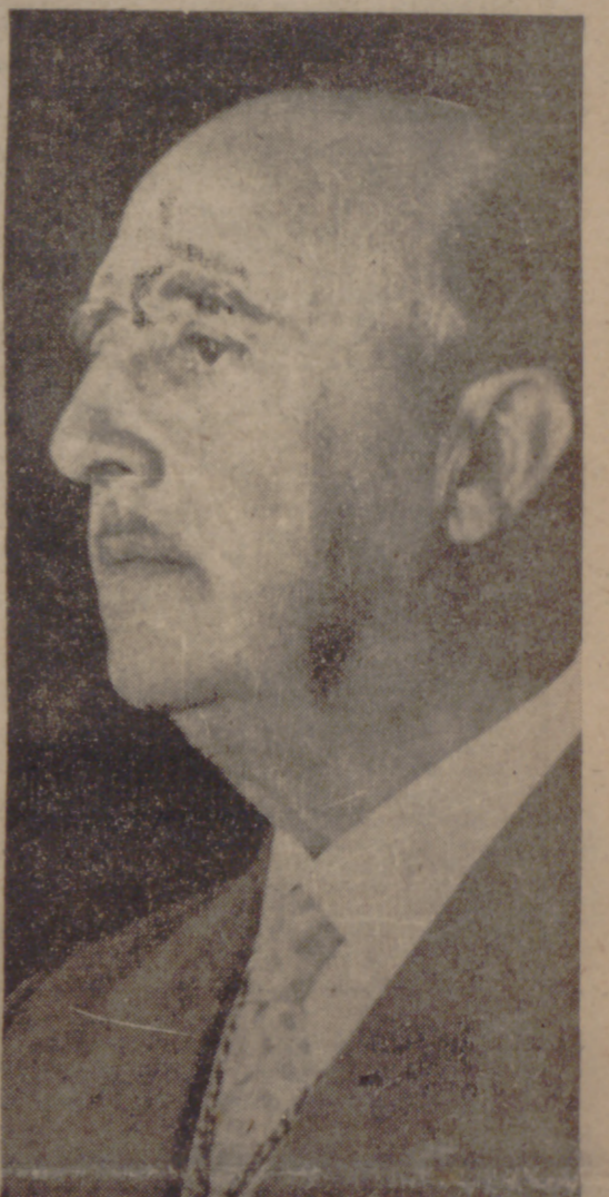
MADRID.—Su Excelencia el Jefe del Estado, Generalísimo Franco, ha inaugurado la VIII Legislatura de las Cortes Españolas.

LOS PRINCIPIOS DE JUSTICIA SOCIAL ENTENDIAN EN SI SOBRE TODO, UNA ADECUADA POLITICA DE RELACIONES HUMANAS.