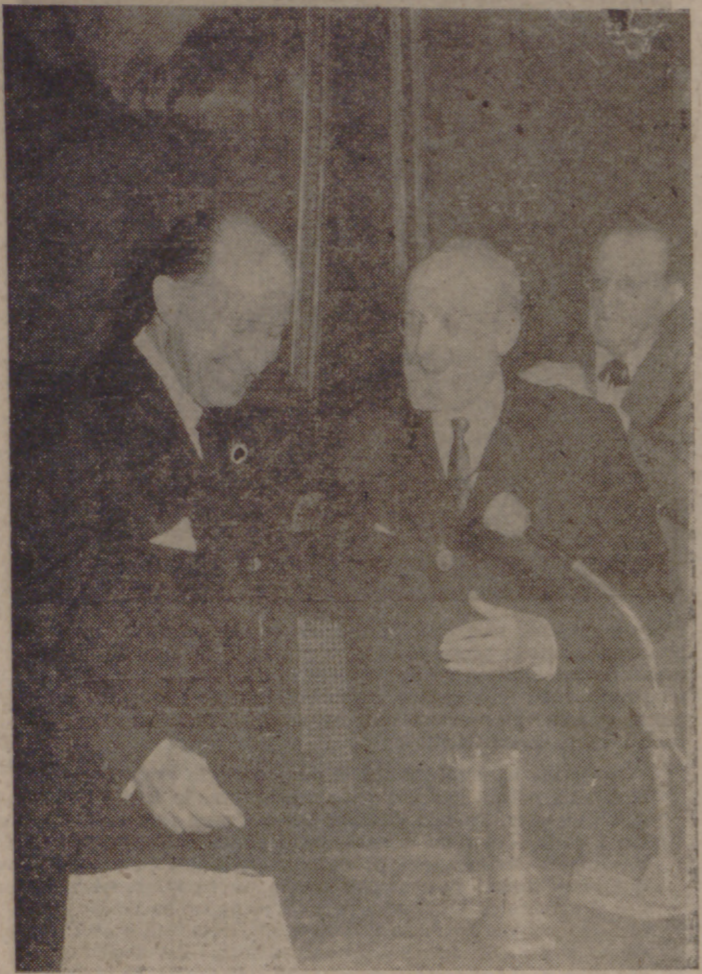
MADRID.—El alcalde de Madrid, conde de Mayalde, impone la Medalla de Oro de la Villa al presidente de la Real Academia Española, señor Menéndez Pidal, en un acto celebrado en el Ayuntamiento.