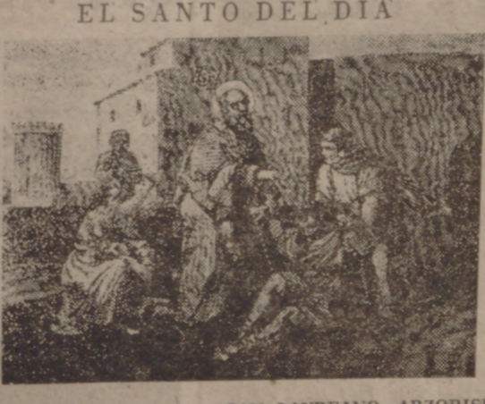
EL SANTO DEL DIA