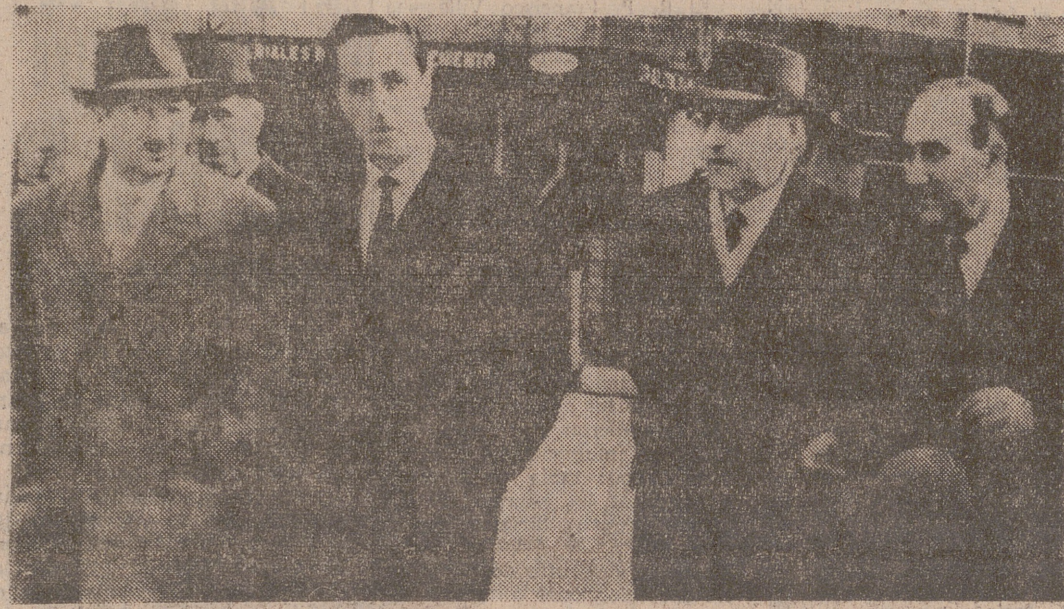
BILBAO.—El ministro de Industria, señor López Bravo, ha llegado a esta capital, donde ha visitado la II Feria de la Herramienta. En la fotografía, el señor López Bravo visitando la citada exposición, acompañado de las autoridades locales.