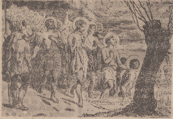
LOS CUARENTA MARTIRES DE SEBASTE († 320)

El tiempo, 9,55; Marcando el tremadura, 12,00; Telediario, compás, 10,00; Los defensores, 12,20; El programa de mañana, 11,00; Festival dedicado a Ex-12,23; Medianoche, 12,30; Cierre,