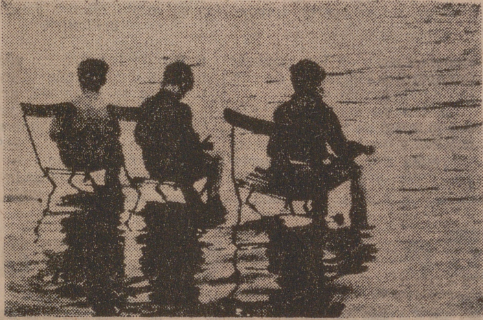
Sin ninguna prisa, con esa paciencia que hay que usar para pensar y pescar, los tres chiquillos se han sentado cómodos en el Serpentino de Hyde Park, cada uno embobado en su mundo de sueños, seguros de una insegura pesca, tranquilos en la paz del silencio, viendo la paz de la tarde.