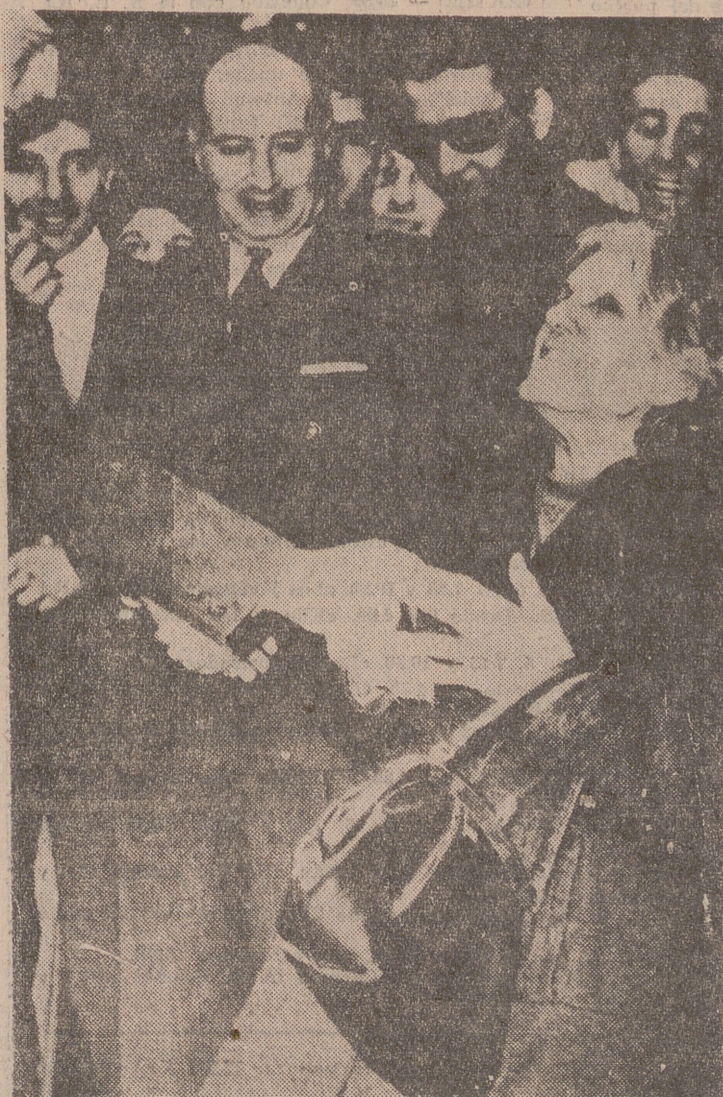
ATENAS.—Una anciana llora desconsoladamente al paso del coche que traslada los restos mortales del rey Pablo desde el Palacio de Tatoi al Palacio Real de Atenas.

Ha salido para Grecia la misión española que asistirá a los funerales