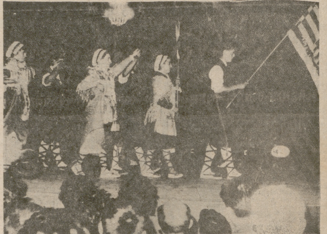
JACA.—Con gran brillantez se ha celebrado el I Festival Folklórico del Pirineo hispano-francés, al que han asistido representaciones de distintas ciudades de los dos países. En la foto aparecen los representantes de la ciudad de Amelie les Bains, durante la presentación de los grupos que toman parte en el Festival.