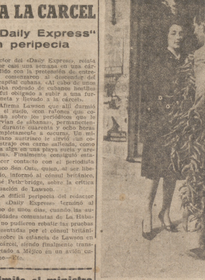
MADRID.—Gentes de toda condición social aportaron su donativo al ser abordados gentilmente por las bellas señoritas postulantess para recaudar fondos con destino a la Cruz Roja.