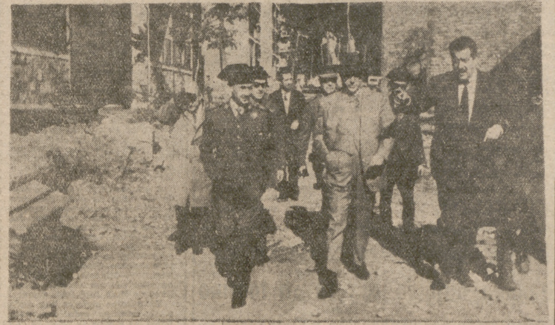
TARRASA.—El gobernador civil de Barcelona, señor Vega, acompañado de las autoridades de esta ciudad, visita los lugares afectados por la segunda riada. Poco después se reunirá con los ingenieros para estudiar la forma de impedir ocurra otro desbordamiento de esta índole.