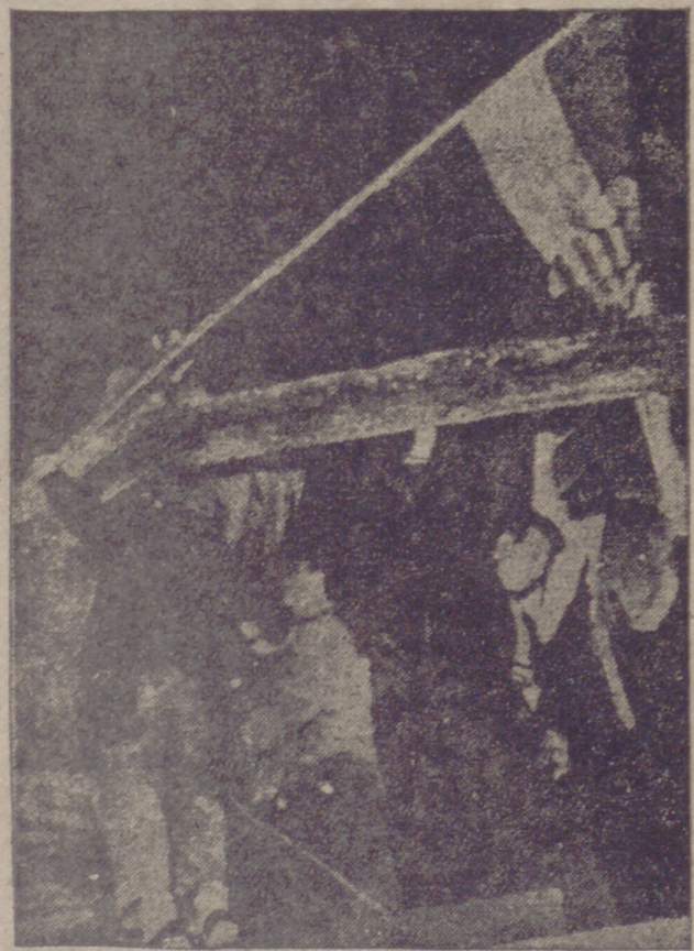
Después de derribar la estatua de Stalin, los rebeldes izan la bandera húngara, blanca, rosa y verde.