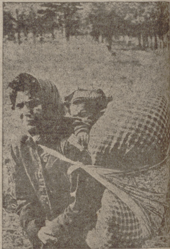
Esta pobre campesina lo único que pudo conseguir fue a su hija, y su último pensamiento fue protegerla por lo menos algo con que protegerla del frío...