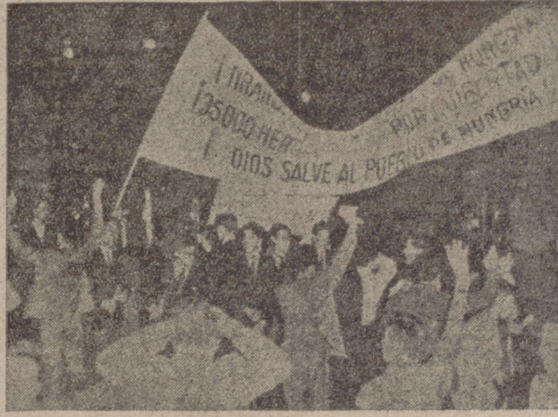
Estado en que quedó el coche del embajador ruso en Buenos Aires, Reznov, después de haber sido incendiado. También en Buenos Aires, un grupo de manifestantes se produce contra los sucesos.

España pide de nuevo el envío a Hungría de una fuerza de la O. N. U.