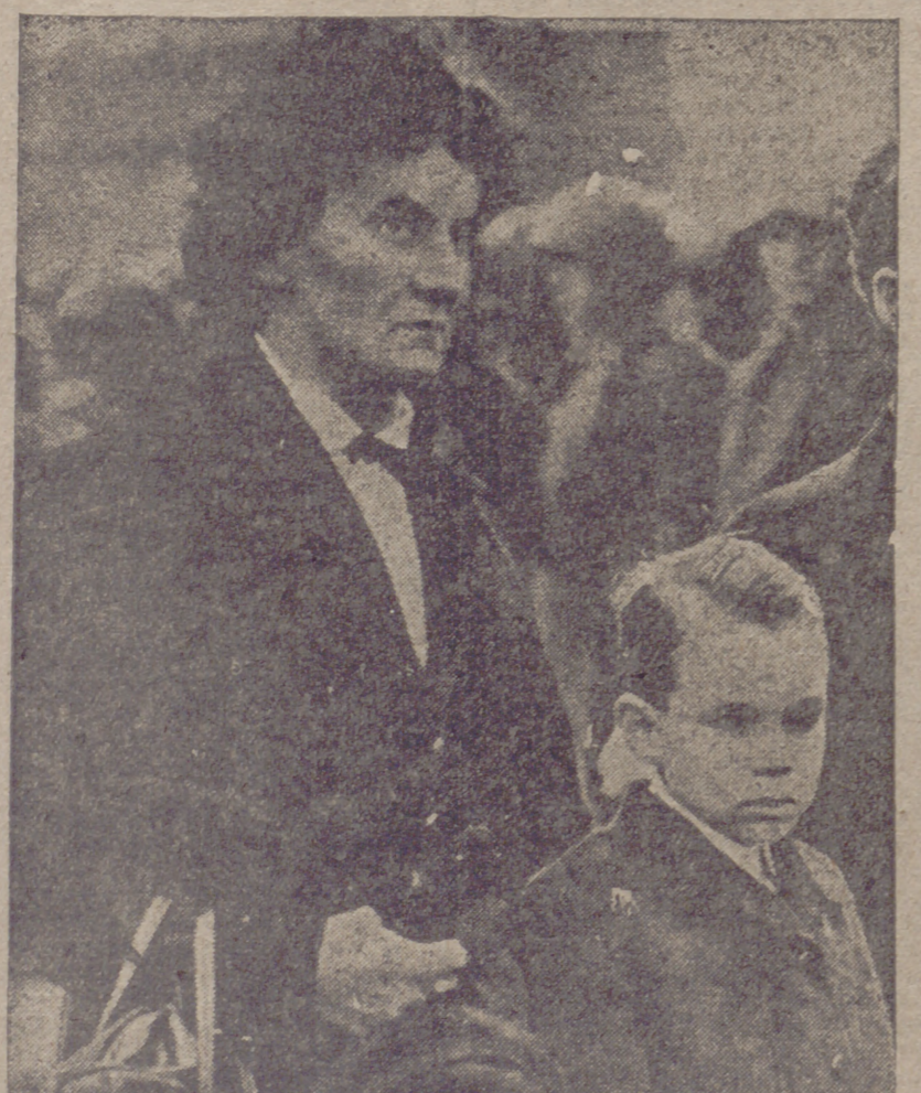
Des víctimas: Una madre y un niño contemplan con angustia el paso de los heroicos patriotas húngaros hacia la lucha.

FU VALLA Esp vas hún Instruc en lo ACUER En el Min urismo se ferencia de e Ministros yer, bajo la ancia el Jefe PRESIDENC reto por el q igencia del e 1946 del comercio. Decreto por ente del Con al a don Pe Orden por ara la adm el Estado en Orden por aña oleícola Los má Tan deca nilitar que on para ros al de Sues nuciar los a temación for Asamblea de u en lo rea nismo sentid Commonweal onservada e mpio Es ie donde vi fuerzas y ce tica descobe ántico. Veinte mit celebrado en yales ciuda e para pro indignación able que p (P EISEN FIELD La Flo Ha co