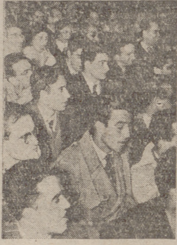
Un grupo de asistentes a la conferencia.

El público asistió con verdadera curiosidad, como lo demostraba el poderse ver el Aula Magna totalmente llena de oyentes, abundando en número casi absoluto la gente joven y los que no lo eran del todo también, con ese espíritu deportivo propio de la juventud contrarrevolucionaria con ella.