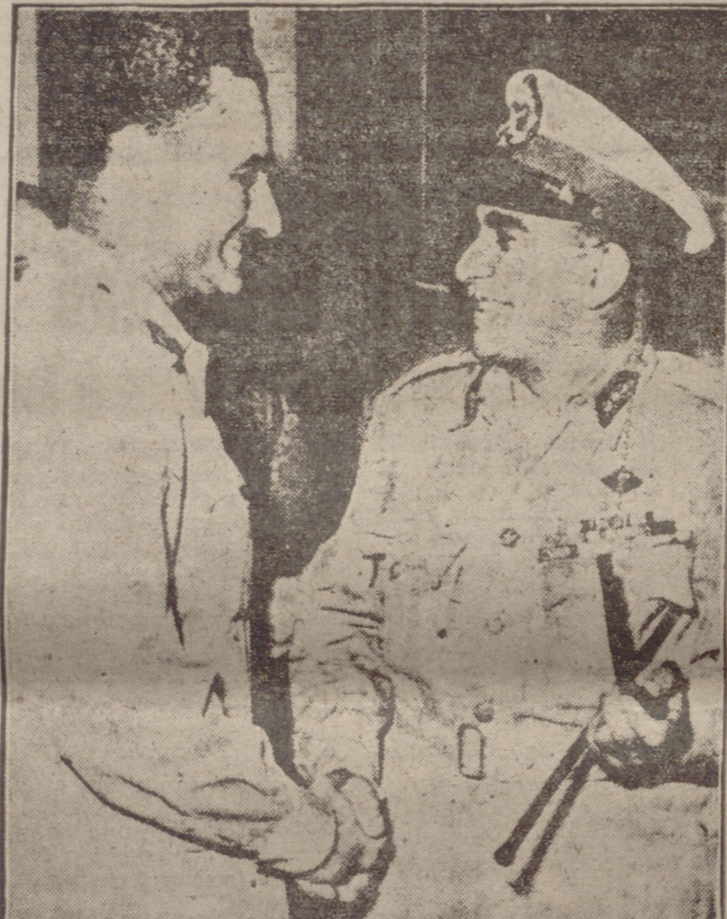
Abdel Nasser y Naguib en los primeros días de la revolución egipcia.

A las nueve de la mañana, mientras que las tropas, bajo las órdenes directas del ferik Naguib bey ceñían las habitaciones reales, Ali Maher bajá se entrevistó con el soberano y acto seguido celebró una larga conversación con el general Naguib. A las diez y cuarto de la mañana, Ali Maher volvió al palacio a dar cuenta al rey de la conversación que había sostenido con el comandante en jefe. Después Ali Maher recibió al emba-