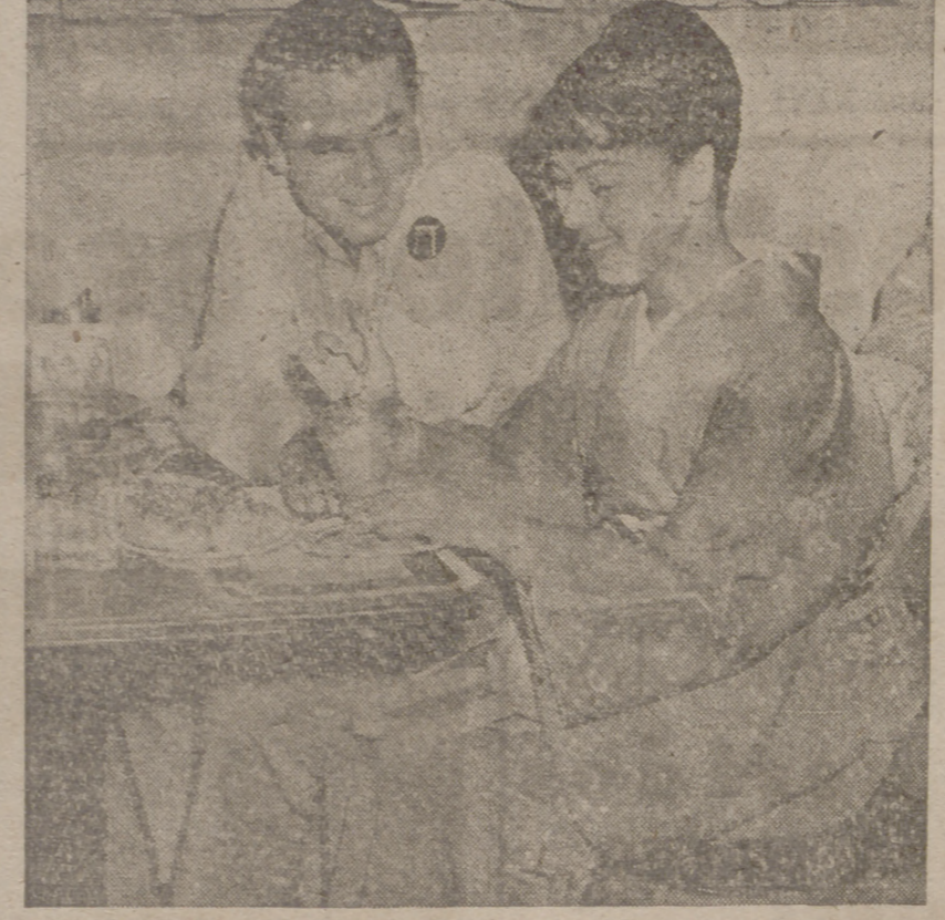
Glenn Ford obsequia a Machiko Kyo con un helado especial, durante el almuerzo en el restaurante de los estudios M. G. M. Ambos comparten honores con Marion Brando en la película "La casa de té de la Luna de Agosto".