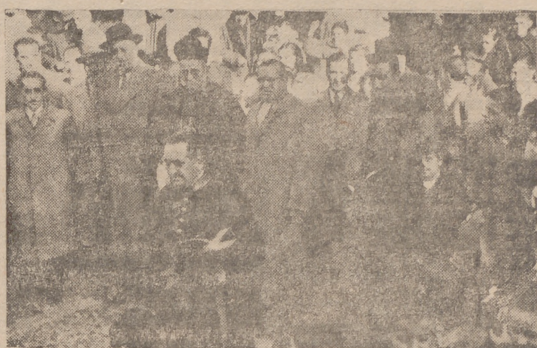
El Prelado, con el acaudalado en sufragio del Conde Ansúrez y su esposa.

Se celebraron ayer en la Catedral, presididos por el Prelado, la Corporación Municipal y asistiendo los niños de los colegios