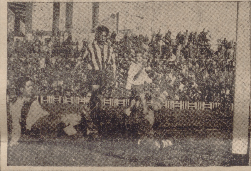
Redondo acusa al portero salmantino, en cuya jugada logró el tercer gol del equipo vallisoletano.

A pesar del tanteo, el Europa no supo aprovechar las facilidades que le dió el Salesianos