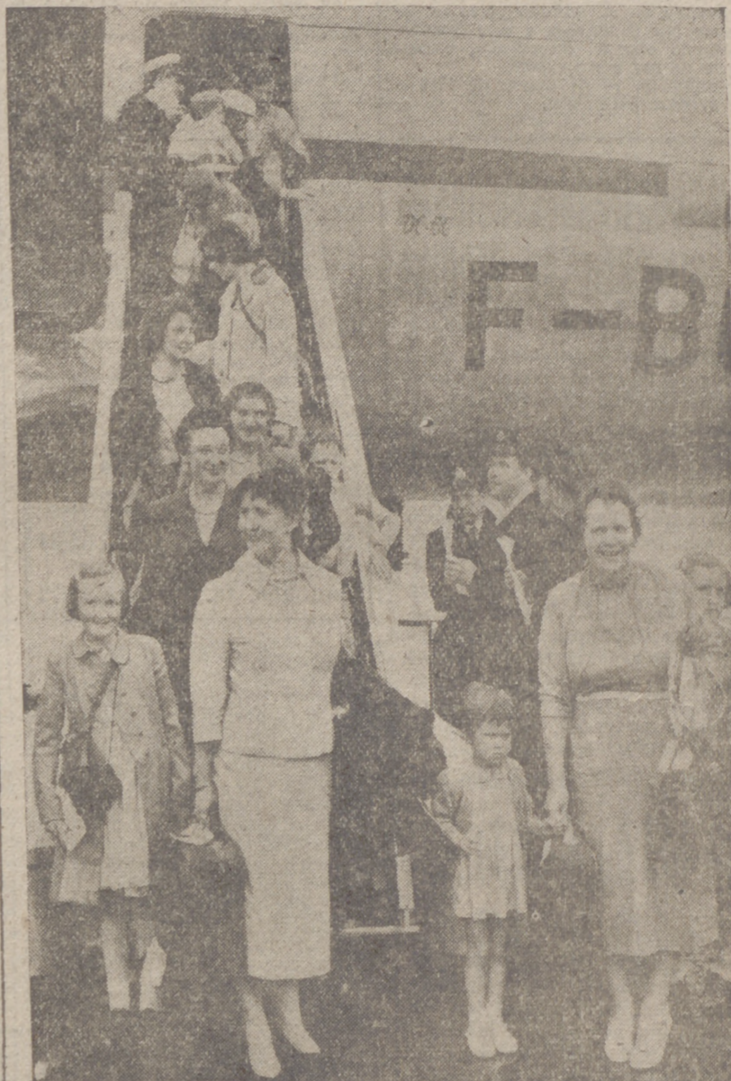
Llegada a Londres de los primeros ingleses evacuados de la zona del Canal de Suez.

Londres, 16.—(Cronica telefónica de nuestro corresponsal, GUY BUENO.)