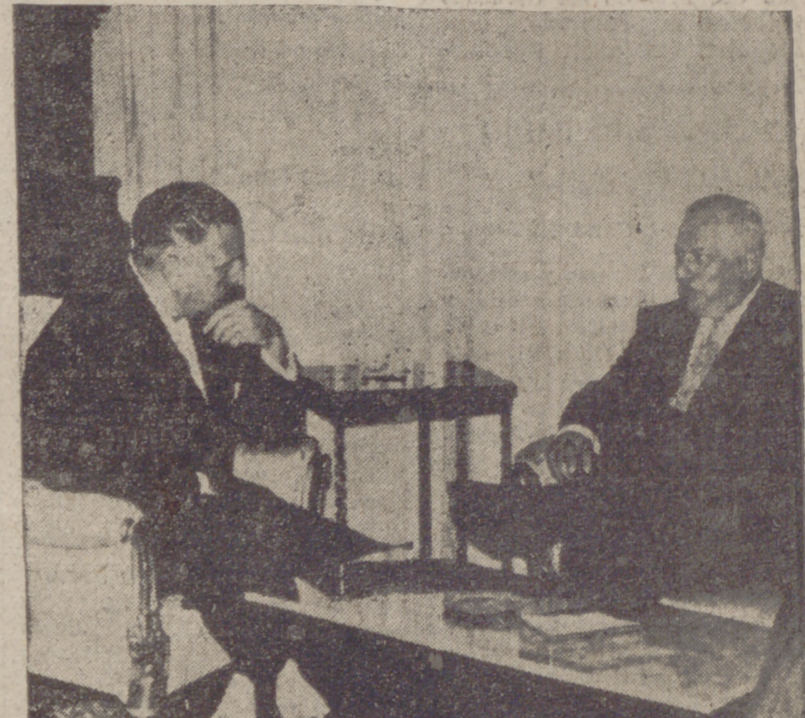
San Sebastián.—El ayudante ejecutivo del secretario general de la ONU, mister Cordier, durante su entrevista con el ministro de Asuntos Exteriores español, señor Martín Artajo.