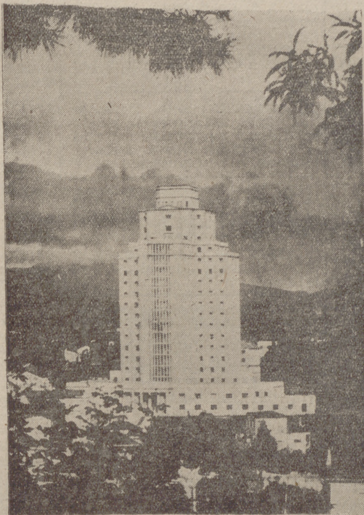
La gran labor del Estado en la lucha contra la enfermedad, que ofrece realizaciones como esta, da ya sus frutos, de los que es consecuencia la magnífica situación sanitaria en España.

Las afecciones cardíacas son las que producen más víctimas en la actualidad No existe peligro de epidemia de parálisis infantil 9.000 muertos por tuberculosis el año pasado; hace ocho años, morían anualmente 25.000 personas