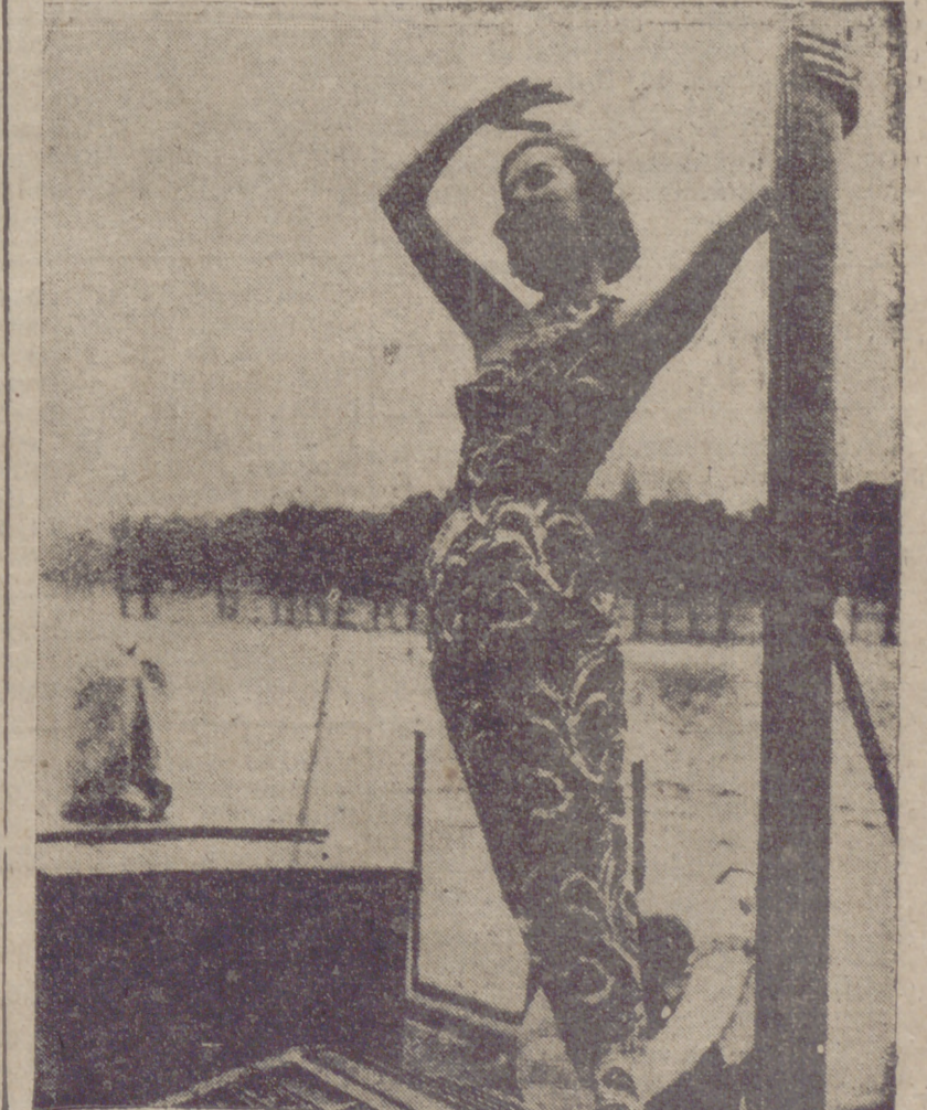
Conjunto para el barco, de André Ledoux, París.