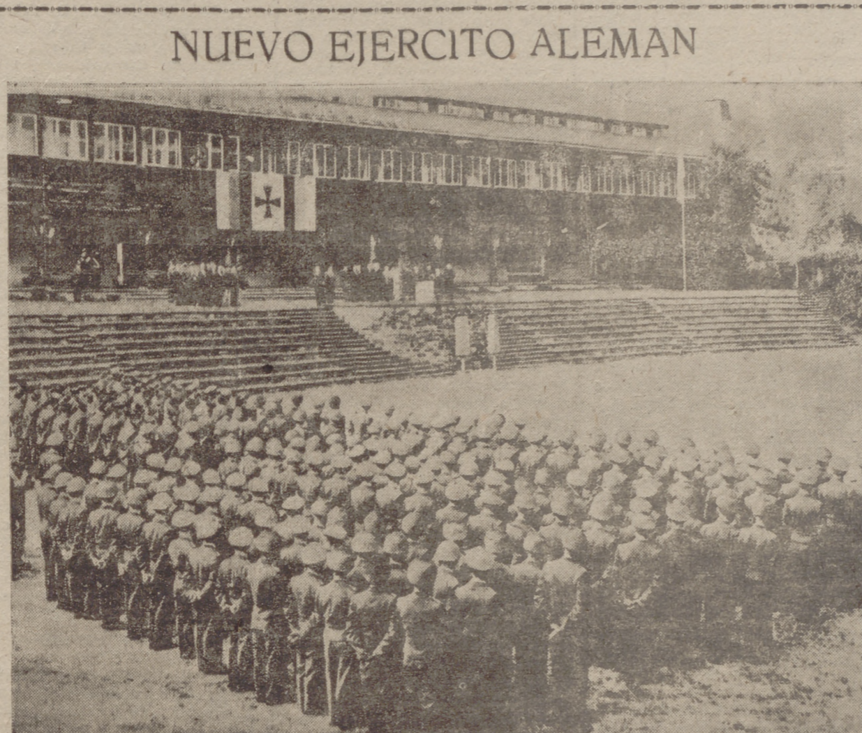
NUEVO EJERCITO ALEMAN

El nuevo ejército alemán se prepara con intensidad y eficacia. En la "foto", formaciones de altos oficiales concentrados en las Lu dwing Beck Barracks, del castillo de Sonthofen, escuchan una alocución del presidente, te Hogner, de Baviera.