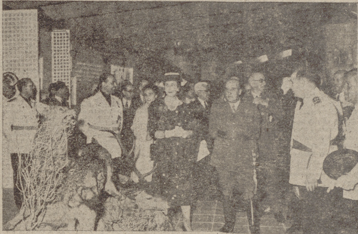
Madrid.—Su Excelencia el Jefe del Estado, acompañado de su esposa, de los ministros de Agricultura y de Trabajo y otras personalidades, durante la inauguración de la III FERIA INTERNACIONAL DEL CAMPO.