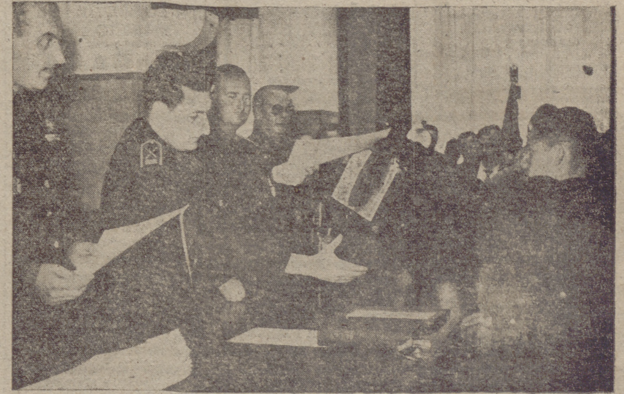
Madrid.—Un momento del acto de clausura de curso y entrega de títulos.

Madrid, 23.—En la tarde de hoy el gobernador civil y jefe provincial del Movimiento de Valladolid, don Jesús Aramburu Olaran, visitó, en su despacho, al ministro de la Gobernación, don Blas Pérez González, con el que trató asuntos relacionados con la provincia vallisoletana.—Cifra.