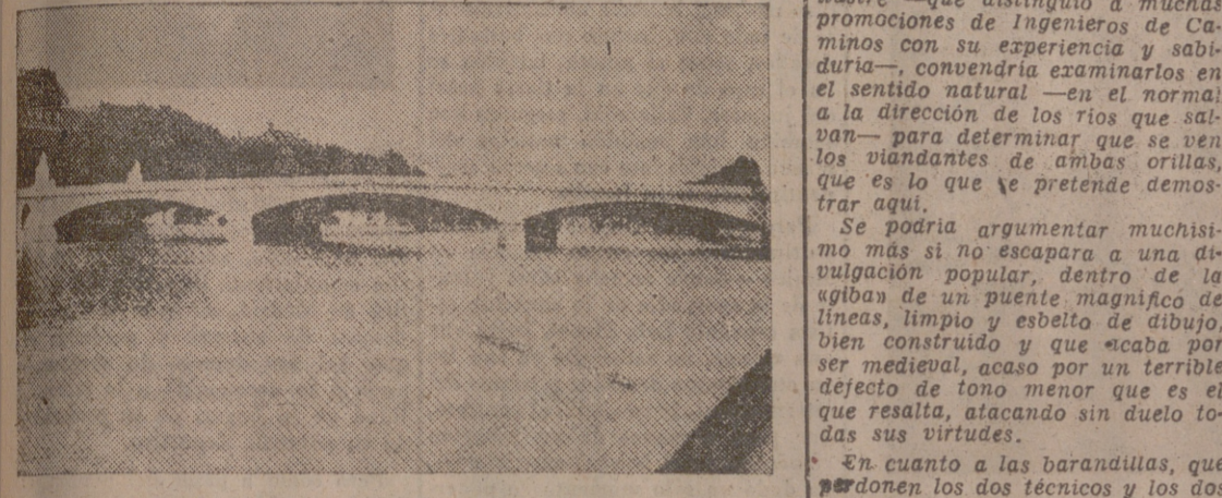
Puente del Carrusel, de París, con panza