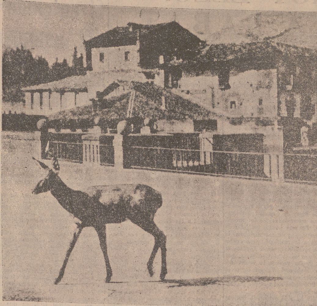
De los siete venados que la Jefatura de Montes de Santander, en colaboración con la Sociedad de Caza y Pesca "Pico de Europa", soltó a las montañas para la repoblación de caza mayor, uno eligió su relativa cautividad, prefiriendo el hermoso paisaje urbanístico de Potes a la silvestre libertad de sus conforinos. De tal manera le gusta Potes a este venado que aquí ven, que volvió al pueblo varias veces detrás de guardas y pastores. El venado hace vida doméstica en la finca del presidente de la Sociedad de Caza y Pesca y pasea irremediablemente por la plaza y las calles de la villa de Potes.