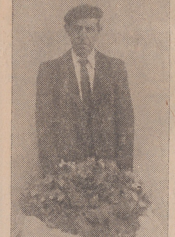
Seta gigante de las llamadas de cardo la encontrada y recogida en la Campa de los Corrales...