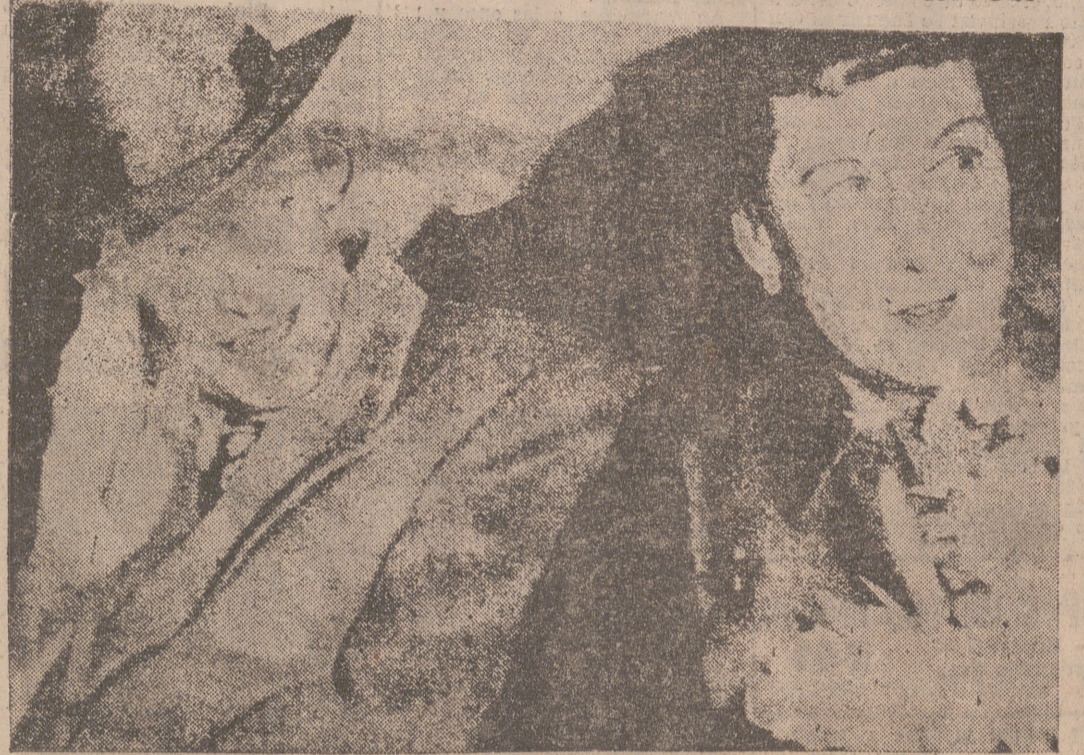
Con este gesto cordial el Presidente de los Estados Unidos, a quien acompaña su esposa, despide a los que en estas últimas semanas le atendieron en el hospital de Fitzsimmons durante su grave crisis. El Presidente fue en coche hasta el aeropuerto, donde le esperaba un avión para reintegrarle a la Casa Blanca.