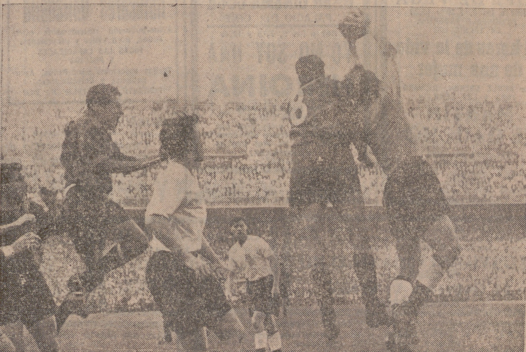
Fue durante el primer cuarto de hora cuando el equipo español puso más furia y calor en la lucha que en el resto del encuentro, y la puerta inglesa se vio asediada, como lo representa la “foto”, en un bilioso ataque de los muchos que se prodigaron entonces.