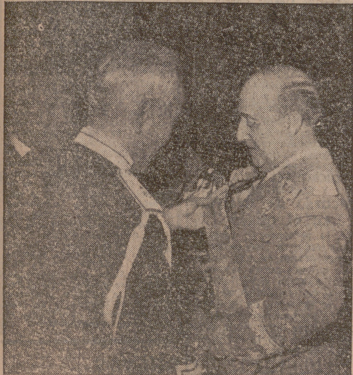
MADRID.—El jefe del Gobierno de Tailandia, mariscal Pibulsonggram, impone a S. E. el jefe del Estado, Generalísimo Franco, el Gran Cordón de la Orden del Elefante Blanco, que el Rey de su país le ha concedido.

La más alta condecoración tailandesa a Franco