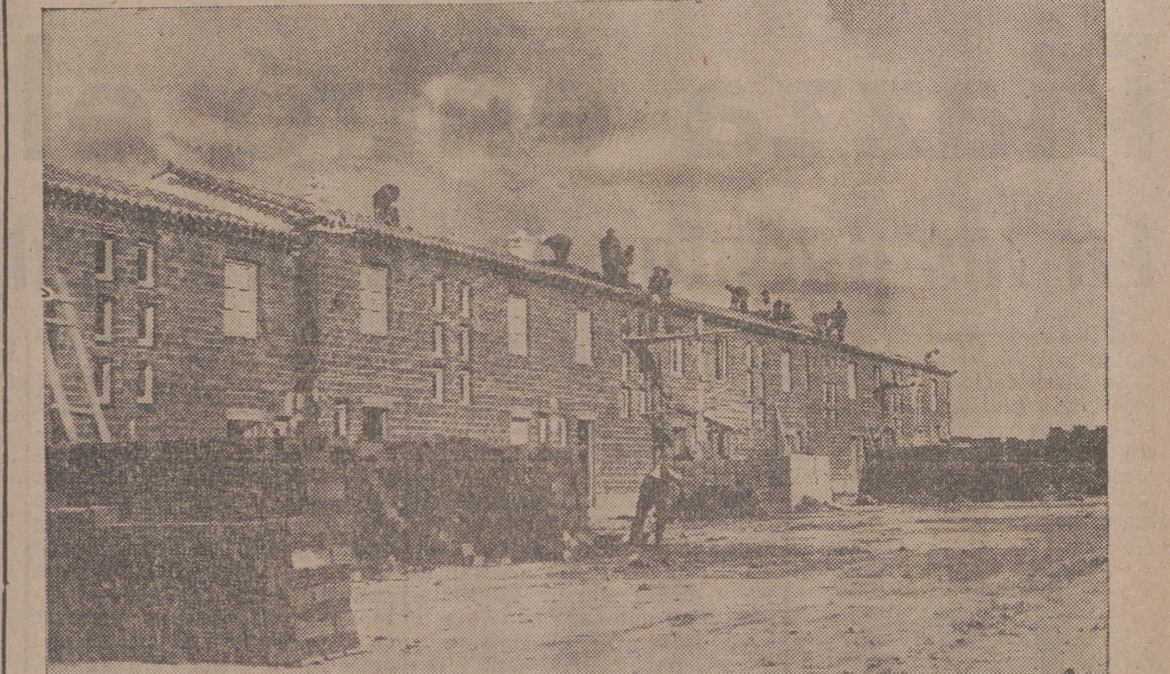
Aspecto parcial de las obras de Iscar.