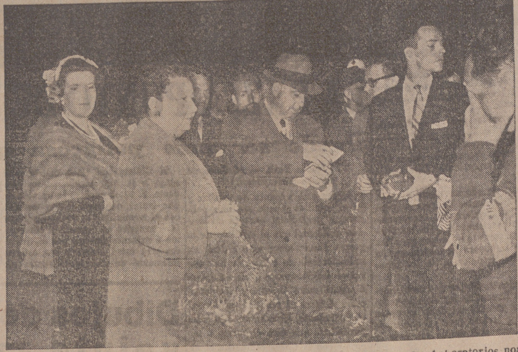
El doctor Jasper Kane, descubridor de la terramicina y vicepresidente de los Laboratorios norteamericanos Pfizer, acaba de llegar a Madrid, acompañado de su esposa, en viaje de visita a España, que durará varios días. El doctor Kane ha conferenciado con innumerables autoridades médicas españolas, entre quienes figuran el doctor Florencio Bustillo, manifestando su complacencia ante los avances hechos por España en el terreno sanitario.