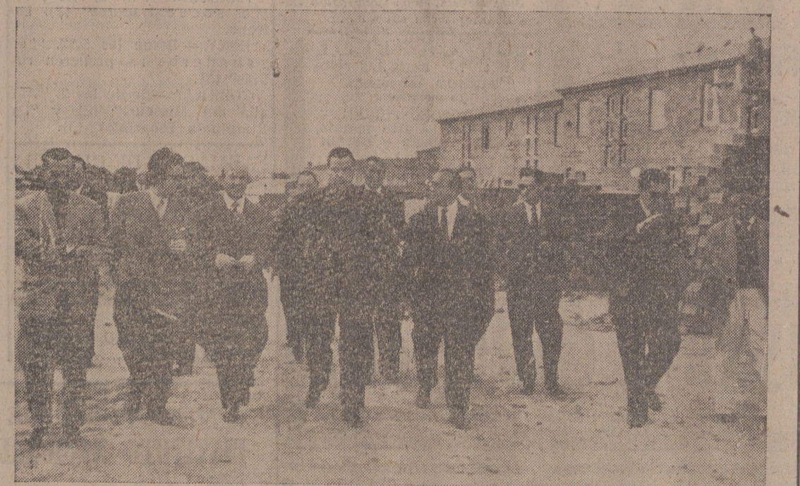
En Medina del Campo.

Su número asciende a 348 y están en período muy avanzado de construcción Jerarquías del Movimiento y sindicales acompañaron al camarada Aramburu