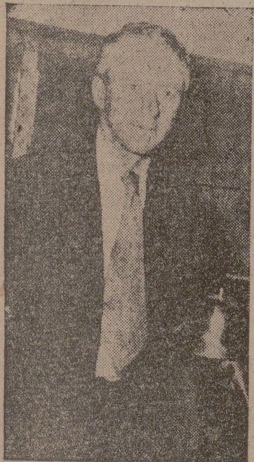
En la Facultad de Ciencias Políticas y Económicas ha dado una interesante conferencia acerca de Pobreza y riqueza nacional, el subsecretario de Trabajo e Industria del Estado de Queensland (Australia), mister Colin Clark.