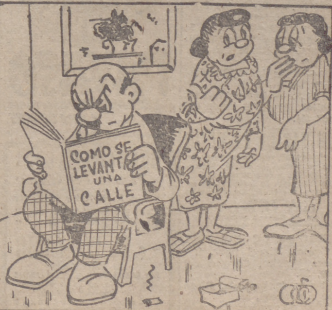
—Dice que se va a presentar para concejal.