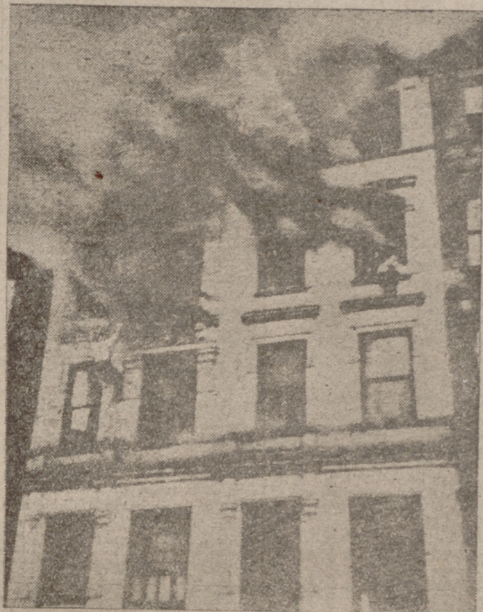
Arde un edificio de los barrios bajos de Nueva York. En la foto vemos, a la izquierda, un hombre colgado de una ventana, y a la derecha, una familia que demanda auxilio. Todos fueron salvados por los bomberos, sin más consecuencias que el susto.