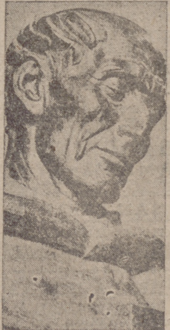
Busto de la estatua monumental de San Pedro de Alcántara, que ha sido realizada por el escultor Pérez Comendador y erigida solemnemente en Cáceres.