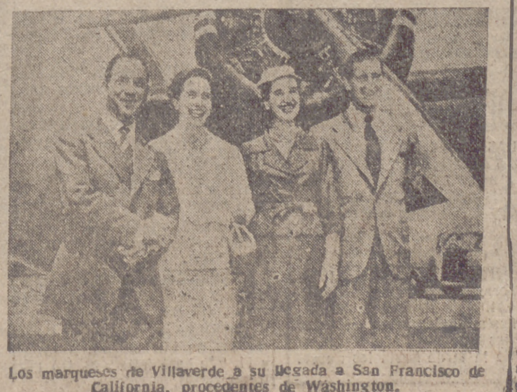
Los marqueses de Villaverde a su llegada a San Francisco de California, procedentes de Washington.