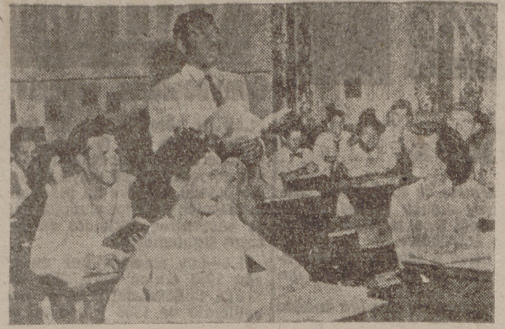
He aquí una escuela a la que no afecta la nueva disposición yanqui en orden a la coeducación por colores. Las escuelas parroquiales de Columbia educaron juntos, desde siempre, a los negros y a los blancos.