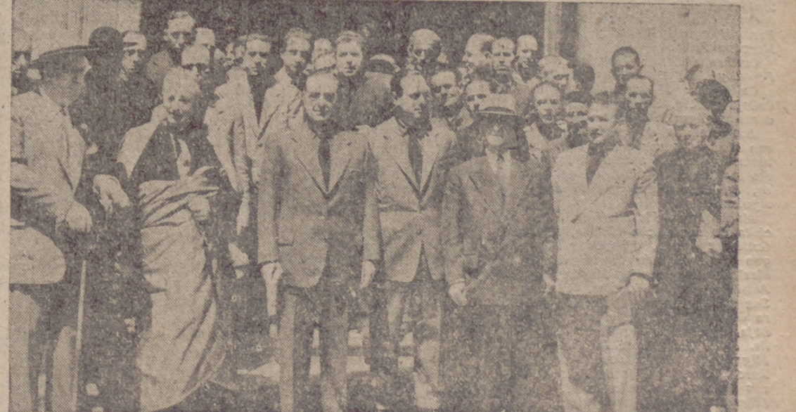
Personalidades asistentes a la Misa de Espíritu Santo celebrada en el Santuario Nacional con motivo de la apertura del curso. (Amplia información, en quinta página.)