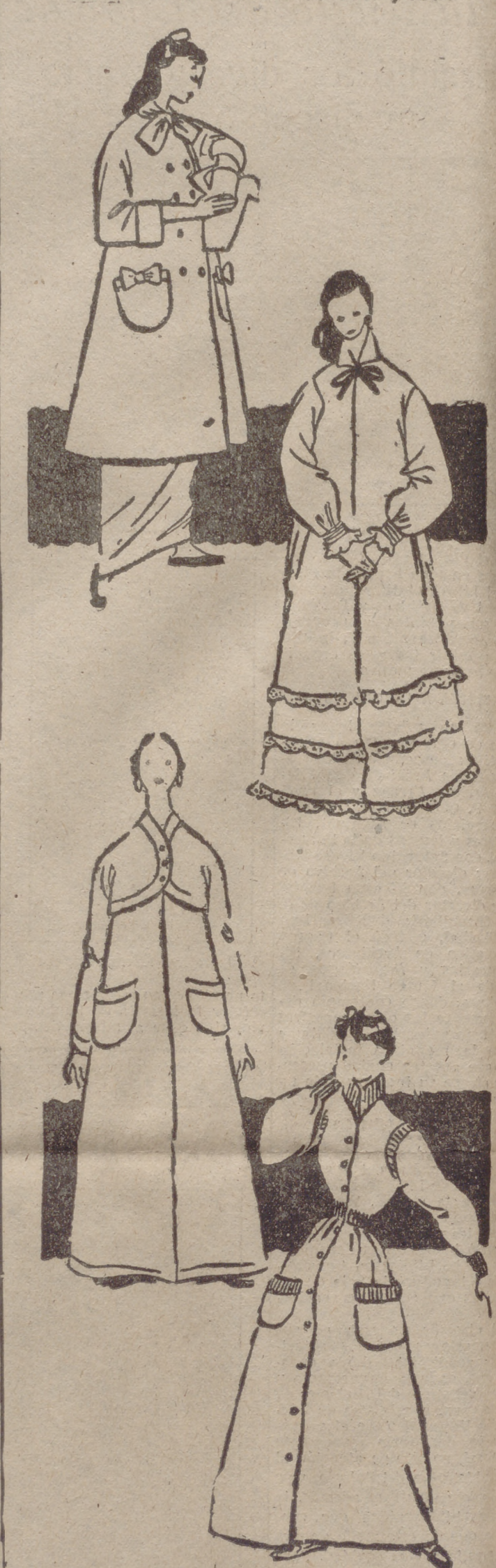
Bata de lana de los Pirineos, con mangas ranglán tres cuartos. Lazos de satén en el cuello y en los bolsillos.