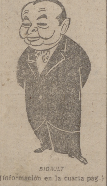
BIDAULT (Información en la cuarta pág.)