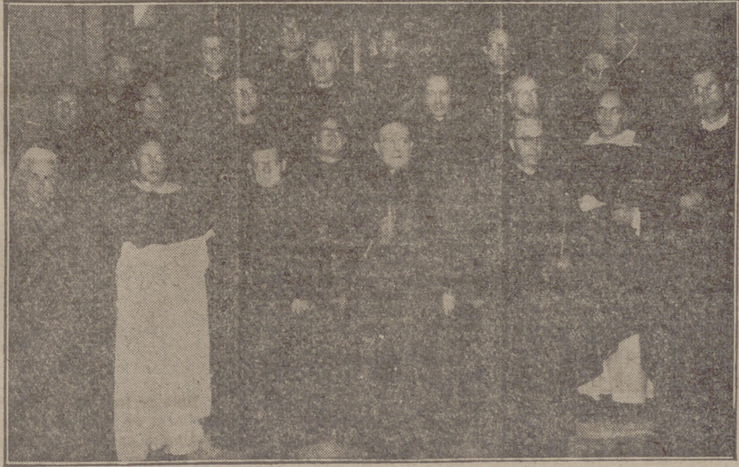
Revelantes figuras que toman parte en los estudios y sesiones de la Semana Josefina