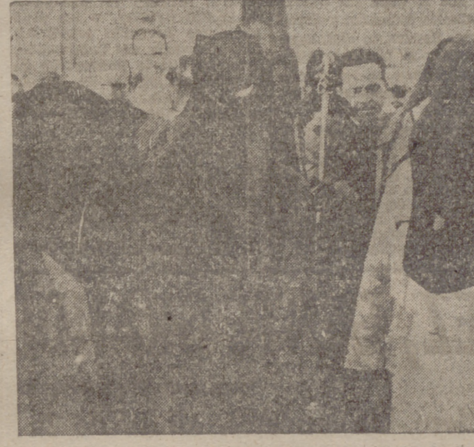
Los tres presos libertados, formando en la procesión de la Caridad y Penitencia.