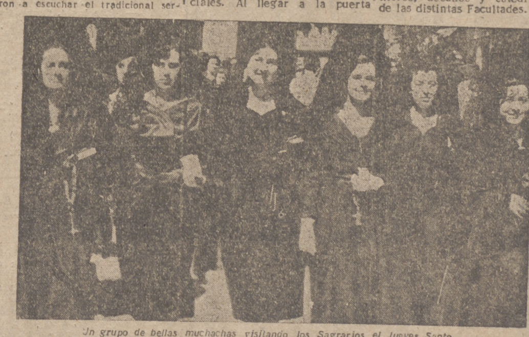
Un grupo de bellas muchachas visitando los Sagrarios el Jueves Santo.