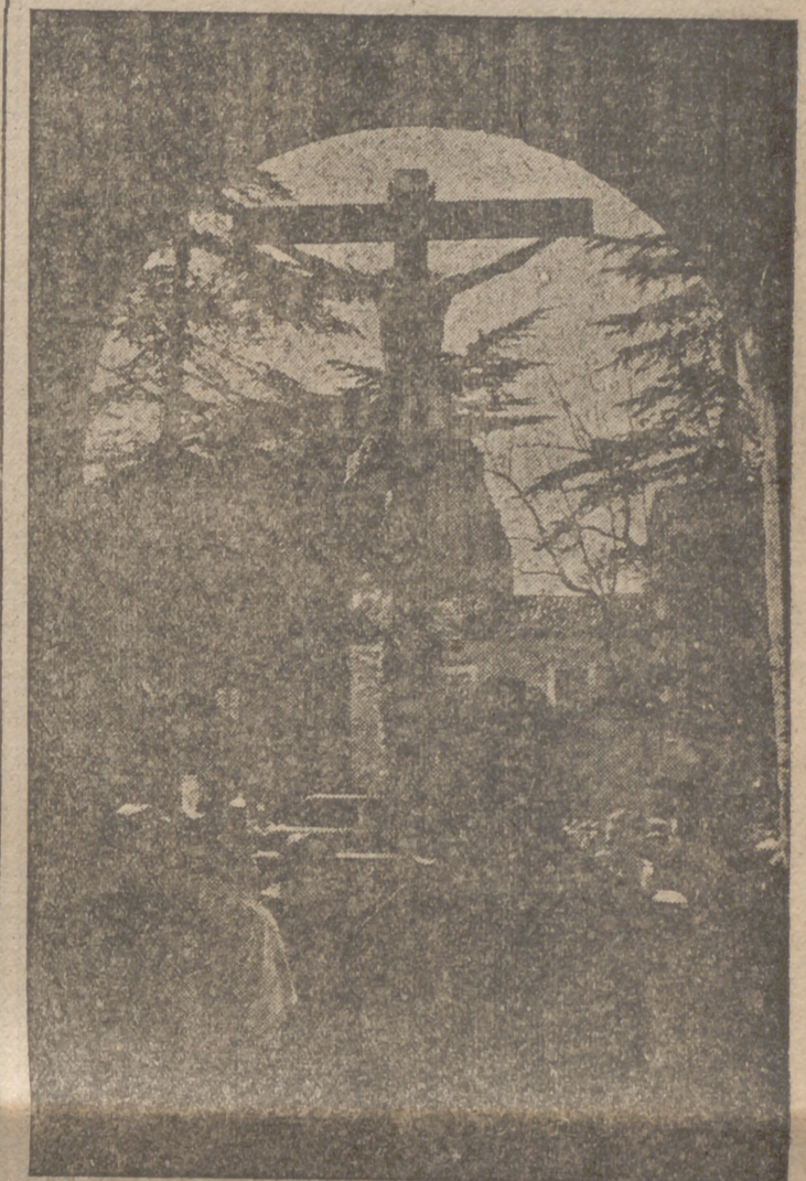
El Santísimo Cristo de la Luz saliendo de su capilla para iniciar la procesión de los Docentes.

Por la tarde tuvo lugar el solemne y tradicional Via-Crucis de Docentes en la S. I. Metropolitana. Se organizó la procesión con el "paso" del Santísimo Cristo de la Luz hacia la Catedral. Formaban en ella la Hermandad, con el colorido de sus togas, y presidían los Prelados y autoridades académicas. El Coro del Seminario iniciaba en la procesión los cantos penitenciales. Al llegar a la puerta