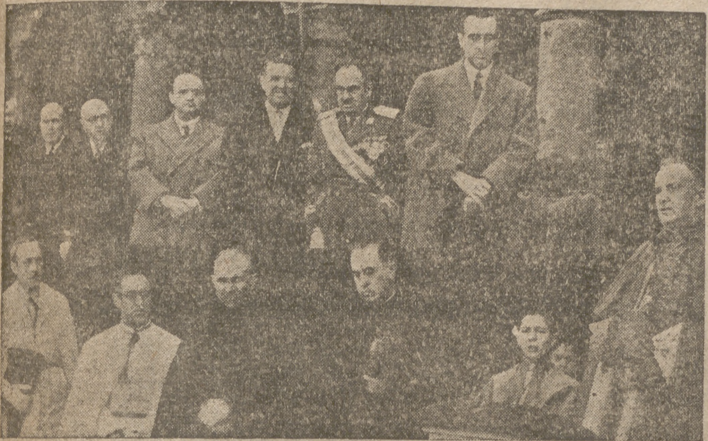
Presidencia del Sermón de las Siete Palabras.

El ministro de Educación Nacional recibió la Medalla de la Hermandad de la Piedad