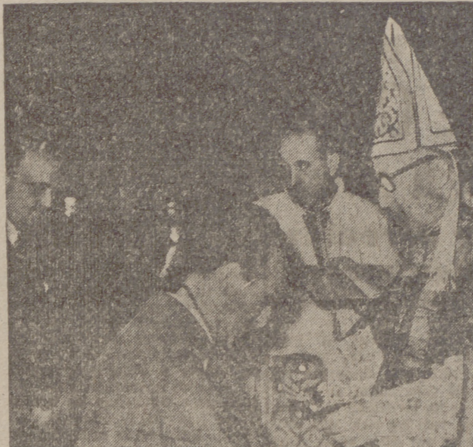
Imposición de la Medalla de Hermano Mayor de Honor de la Piedad al Ministro de Educación, de manos de nuestro Prelado.

El "Santo Entierro" llevaba escolta de la Guardia Civil, y el "Santo Sepulcro" iba seguido de la Banda de música del Orfanato Provincial. Al final, el hermosísimo "paso" de la "Virgen de los Cuchillos", admirablemente adornado en su bellísima carroza.