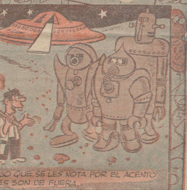
-DESDE LUEGO QUE SE LES NOTA POR EL ACENTO QUE USTEDES SON DE FUERA.