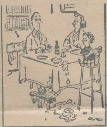
— ¿Ves? ¡Apenas si toca la comida!

LA VISTA Y LA NARIZ El señor era chato tan chato, que su nariz apenas se veía. Al pasar todos los días frente a una mendiga, en el portal, le daba una limosna. La mendiga decía invariablemente: — Que Dios le conserve la vista, señor. — ¿Por qué me dice siempre eso — preguntó un día el señor. Y le dijo la mendiga: — Figúrese, señor; si tuviera que llevar gafas, ¿sobre qué iban a descansar?