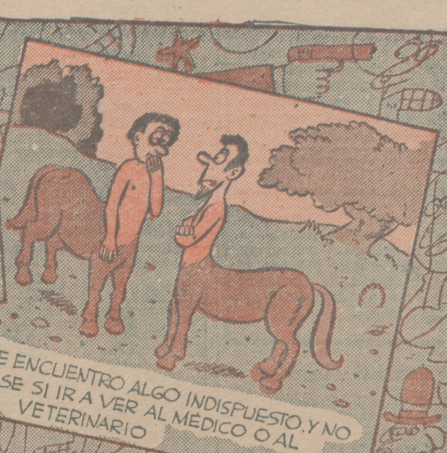
-ME ENCUENTRO ALGO INDISPUERTO, Y NO SE SI IR A VER AL MÉDICO O AL VETERINARIO