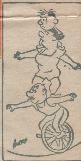
— ¡Ahora no puede ser, mamá! Espera!

LENGUA CORTA Cada vez que quería algo en la mesa, el niño estiraba el brazo hacia la fuente. — ¿No te he dicho que eso es de mala educación? — le reprendió la madre —. Acaso no tienes lengua? — Sí, mamá — dijo el niño —, pero no llega hasta allí.