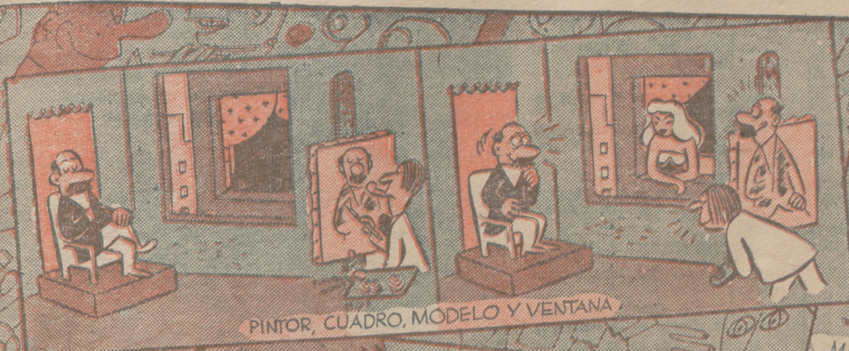
PINTOR, CUADRO, MODELO Y VENTANA