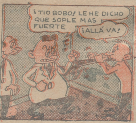
¡TIO BOBO! LE HE DICHO QUE SOPLA MAS FUERTE ¡¡ALLÁ VA!