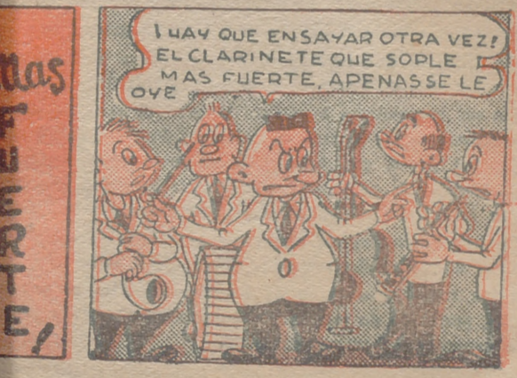
¡UAY QUE ENSAYAR OTRA VEZ! EL CLARINETE QUE SOPLA MAS FUERTE, APENAS LE OYE