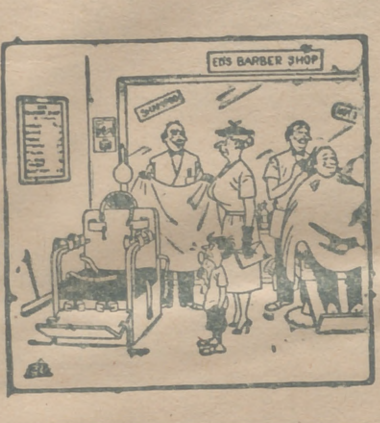
— Francamente, señora; el caballito no nos daba buenos resultados...