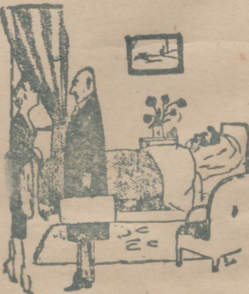
— Que guarde cama, déle mucho bicarbonato y... tome usted lecciones de cocina.