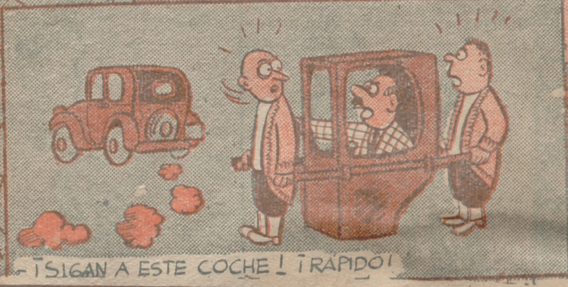
-¡SIGAN A ESTE COCHE! ¡RAPIDO!