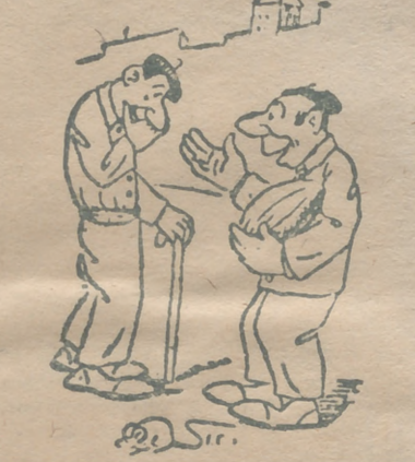
— Es que cuando come me llón le da el cólico, ¿sabes? Es para mi suegra.