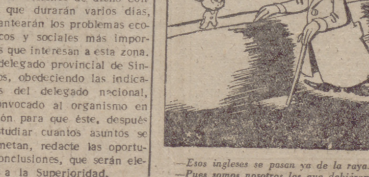
—Esos ingleses se pasan ya de la raya. —Pues somos nosotros los que debiéramos pasarnos de La Línea.