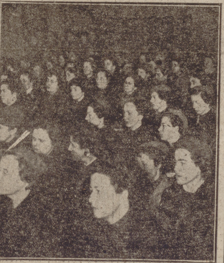
La Sección Femenina ha rendido homenaje a uno de los fundadores de la Falange, Julio Ruiz de Alda, el glorioso aviador. Ante su tumba, Pilar Primo de Rivera deposita un ramo de flores. En la fotografía inferior, aspectos del salón en que se celebró, en Pamplona, la clausura del Consejo Nacional de la Sección Femenina.