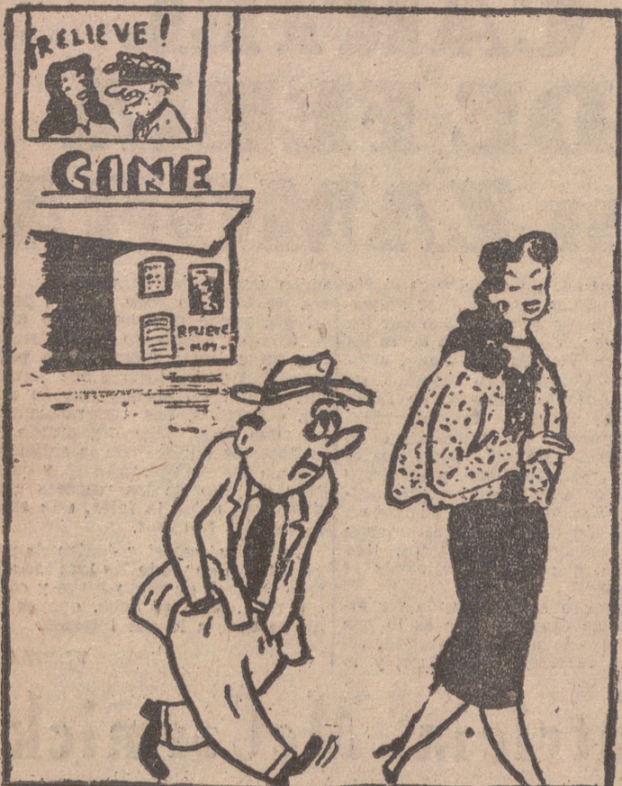
—Comprendes, querida, por que no queria yo ver esta pellicula de ladrones en relieve...? [Resulta que uno de esos tipos me ha quitado la cartera]