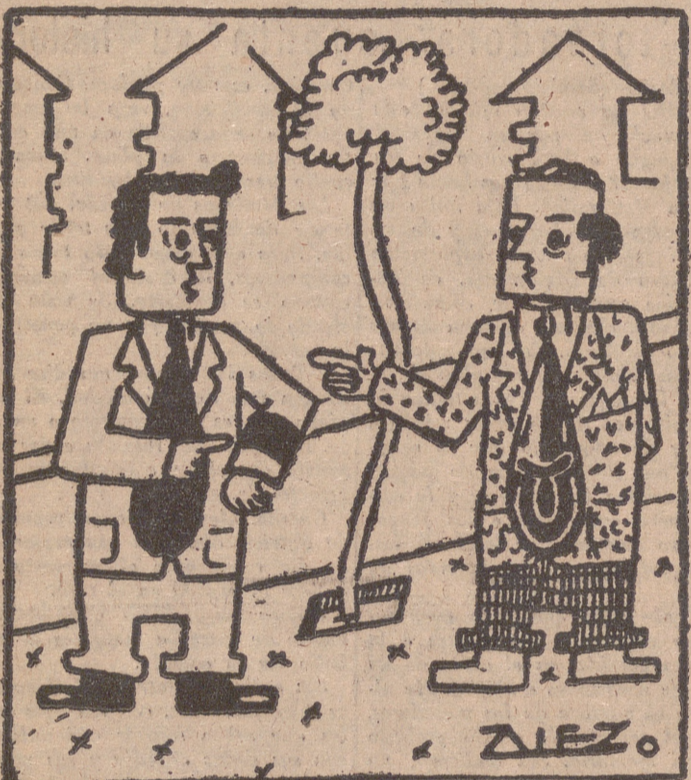
—¡Oye! ¡El luto se lleva ahí! —Sí, pero el roto lo tengo aquí.