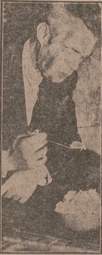
El general Dean toma su última escudilla de arroz antes de ser repatriado. Su traje es ya pulcro y bien cortado.

«Los hombres se refugiaron en un carro blindado. Por fin comenzamos a subir una montaña. Yo marchaba a la cabeza del grupo, diecisiete hombres, cuando llegó mi ayudante y me comunicó que había un herido que no podía continuar, por tener la herida en una pierna. Entonces oí el susurro del agua, y como estaba sediento, por no haber bebido en todo el día, decidí buscar el arroyo. Mi ayudante llevaba algunas tabletas de «Halozona». Cuando me