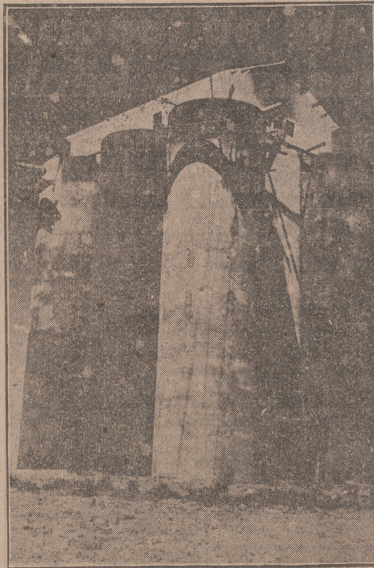
Silo de Tordesillas, cuyos anchos cilindros le dan semejanza con una torre avanzada de la defensa de un castillo en la antigüedad.

El silo de la carretera de Adanero, junto a Valladolid, se compone de un edificio de tres cuerpos de distribución en el interior, los de los lados añadidos al primitivo que formaba una torre de 42 metros de altura. Está encerrado en un recinto dentro del cual se contiene