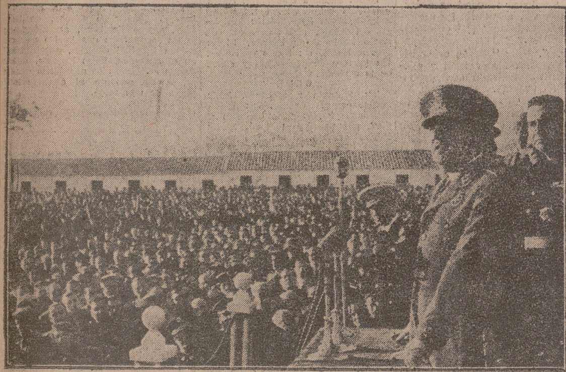
SEVILLA.—S. E. el Jefe del Estado durante el discurso que pronunció en el acto de entrega de viviendas en la barriada de Santa Teresa.