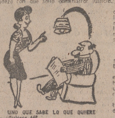
—UNO QUE SABE LO QUE QUIERE