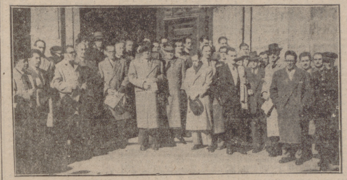
ASISTENTES A LA SANTA MISA CELEBRADA EN EL SANTUARIO NACIONAL