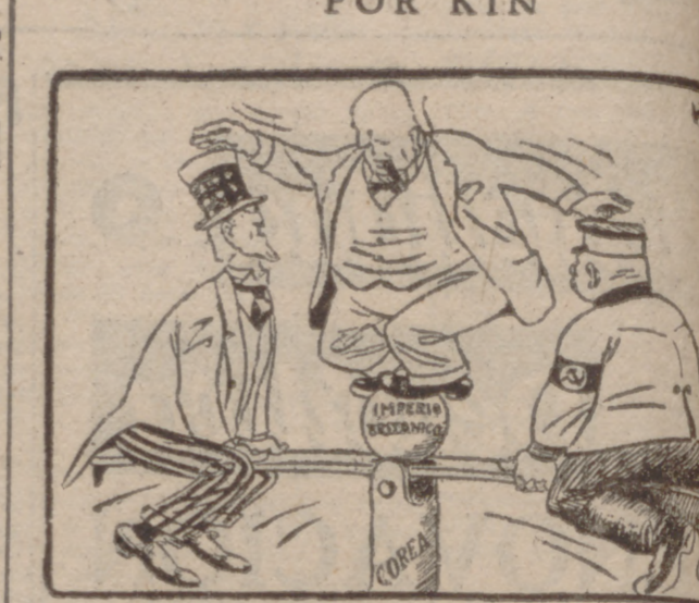
El equilibrista. — ¡Mientras la cosa esté en tablas...

La superficie de siembra de remolacha será igual a la de la pasada campaña