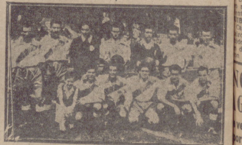
El equipo del Europa-Delicias.

Mucho nerviosismo y gran entusiasmo del Europa-Delicias