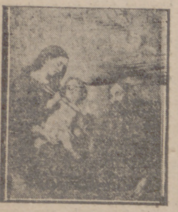
San Agustín, obispo

JUEVES 28 San Agustín, obispo, confesor y doctor. Misa propia, color blanco. Segunda oración de San Hermete y tercera "Ad repēlendas tempestates". Credo.