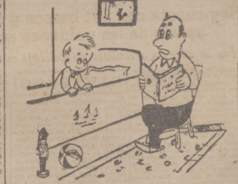
Papa, para corresponder a tu cuento voy a contarte yo las aventuras de Rita Hayworth.

Conversación entre marseleses, quienes, como se sabe, son los andaluces de Francia: —Cuando yo estube explorando la selva virgen, topé con una gruta magnífica, que pegabas allí un tiro y el eco lo repetía veintitrés veces como si fuera una ametralladora. —Eso no es nada para el eco de un palacio moro que yo visité en mis viajes por Oriente. En aquel palacio pegabas un tiro y el eco preguntaba en seguida: "¿Ha habido algún muerto?"