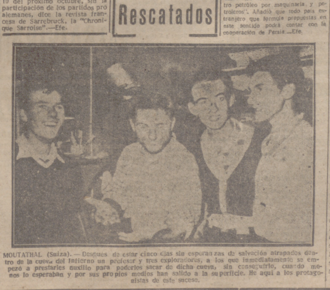
MOUTATHAL (Suiza). — Después de estar cinco días sin esperanzas de salvación atrapados dentro de la cueva del Infierno un profesor y tres exploradores, a los que inmediatamente se empezó a prestarles auxilio para poderlos sacar de dicha cueva, sin conseguirlo, cuando menos lo esperaban y por sus propios medios han salido a la superficie. He aquí a los protagonistas de este suceso.

Un hombre de 60 años se casa con una novia de 60 años. El matrimonio se celebró en una ceremonia que se celebró en un templo de la zona.